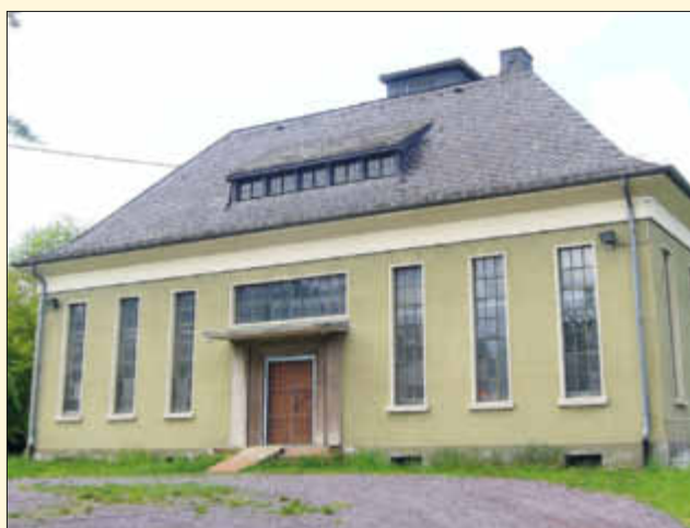
Das Querhaus des T-förmigen Wasserwerks (1936) im neoklassizistischen Architekturstil errichtet

Die zahlreichen historischen Bauten in Wallerfangen kennzeichnen ein Intermezzo von Baustilen, wie sie unterschiedlicher nicht sein können. So wundert es nicht, dass selbst ein Funktionsbau im Stil des Neoklassizismus und mit Andeutungen einer repräsentativen Machtarchitektur aufwartet. Das sonderbare Bauwerk (1936) liegt im weiten Tal des Wallerfanger Baches, südlich vom Jugenddorf Blauloch im „obersten Schäferbruch“. Dass dieses eigentümliche Gebäude mit einer bemerkenswerten Formensprache aufwartet, ahnt der unwissende Betrachter nicht, der sich dem hoch umpflanzten Gelände nähert.