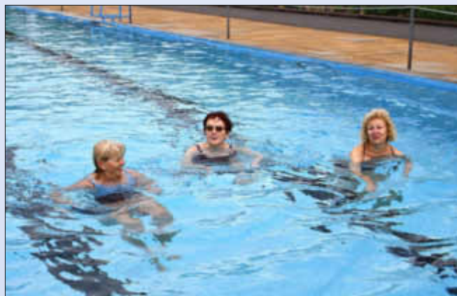
So fröhlich schwimmt man, wenn man die Dampfsauna nutzen kann!

Nebelschwaden umhüllt, die sich als kleine Rinnsale an den Wänden niederschlagen. Ein heißer Tropfen von oben ist der gleiche Effekt. Das gleiche geschieht auf Ihrer Haut. Sie können also davon ausgehen, dass es sich dabei nicht um Schweiß handelt. Es ist vielmehr der pure Wasserdampf, der an der Hautoberfläche kondensiert und dabei Wärme freisetzt.