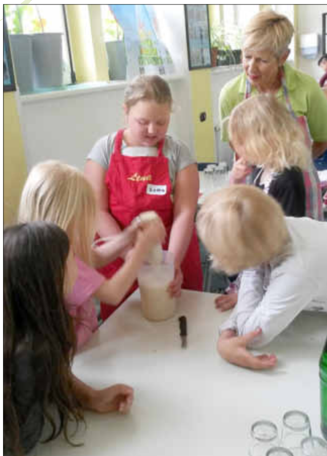
Mit großem Eifer wird die Bananenmilch gemixt