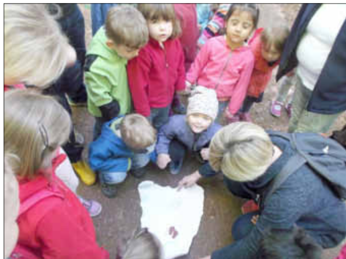
Wir entschlüsseln gemeinsam den Wegeplan.

In den Tagen zuvor hatten sie von der Geschichte des Drachen Ohne-zahn gehört und viel darüber erzählt. Unter anderem war die Rede davon, dass der Drache nun im Gisinger Wald lebt und zwar auf einem Baumhaus hoch oben im Gipfel eines hohen Baumes.