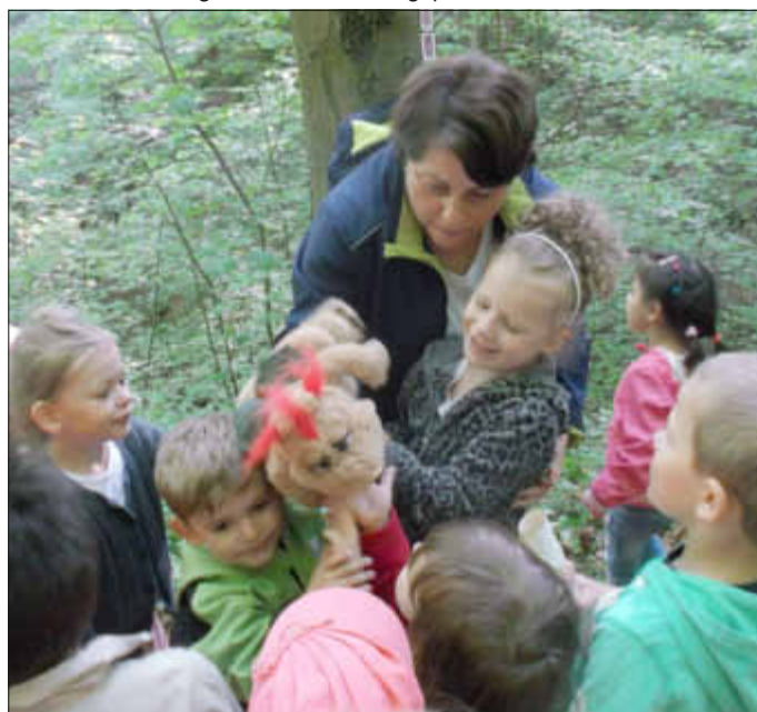
Toll! Wir haben Drache Ohnezahn gefunden!!