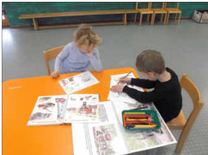
Die Kinder erarbeiten ein Übungsblatt.

Es fanden Gespräche dazu statt, es wurden Bilder gezeigt, Bilderbücher gesehen und vorgelesen und auch Übungsblätter erarbeitet. Einige Kinder konnten schon vieles über die Feuerwehr berichten, da z.B. ihr Papa bei der Freiwilligen Feuerwehr arbeitet.