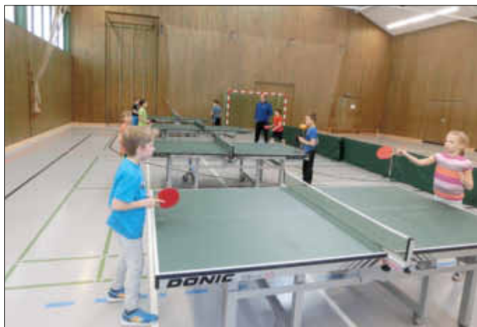
Umsetzen des soeben „Gelernten“ in die Praxis