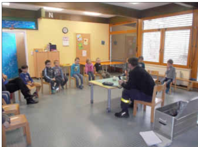
Das mitgebrachte Telefon wird gleich ausprobiert...

Das „Selbst tun“ bleibt natürlich am besten in Erinnerung und so erzählten die Kinder auch noch an den folgenden Tagen immer wieder von diesen Dingen.