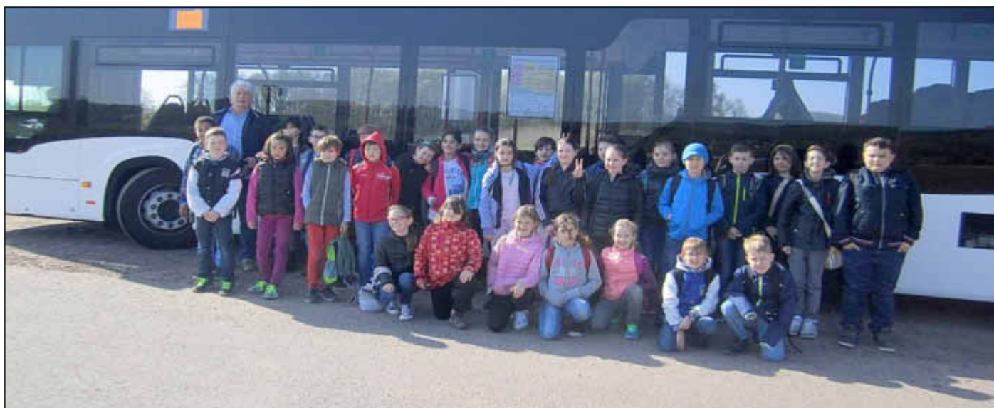
Die Viertklässler der Grundschule Wallerfangen auf „Industrie-Reise“