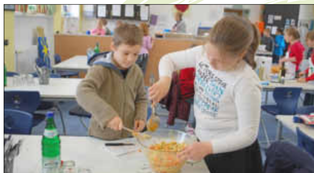
Mit Teamarbeit gelingt alles besonders gut.