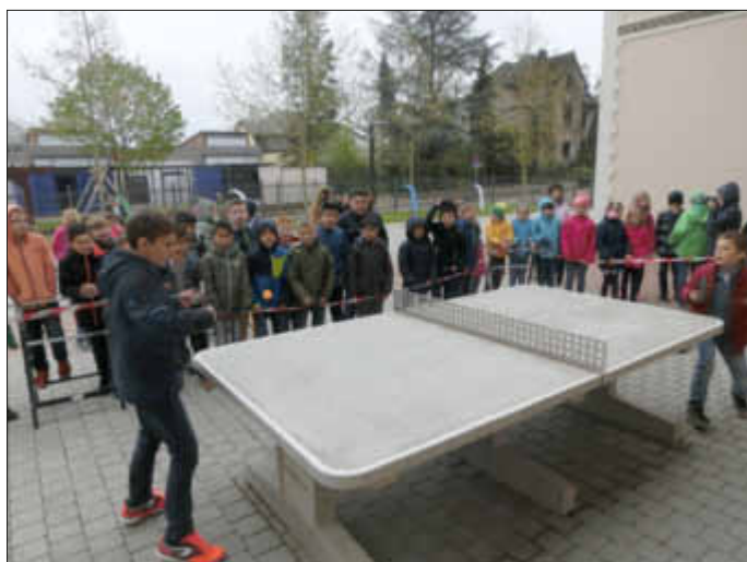
Eines der hartumkämpften „Endspiele“