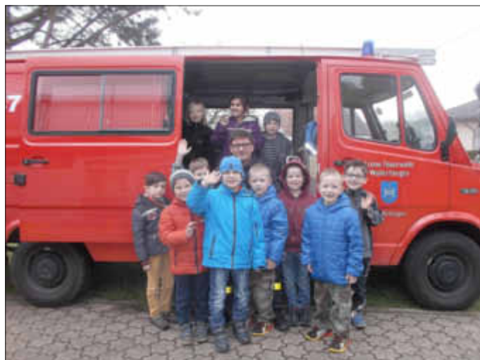
Das Feuerwehrauto gefiel ganz besonders gut...!!

Da war klar, dass etliche Kinder nun Feuerwehrmann werden wollen!! Kein schlechtes Ziel, denn ohne diese wären wir alle „ganz schön aufgeschmissen!“