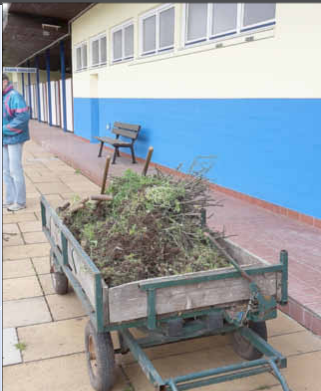
Die Ausbeute des ersten Unkraut-Jätens

Die ersten beiden „Arbeitseinsätze“ im Freibad in diesem Jahr verliefen dank der tatkräftigen Mithilfe einiger Schwimmer und „Schwimmbadfans“ sehr erfolgreich!