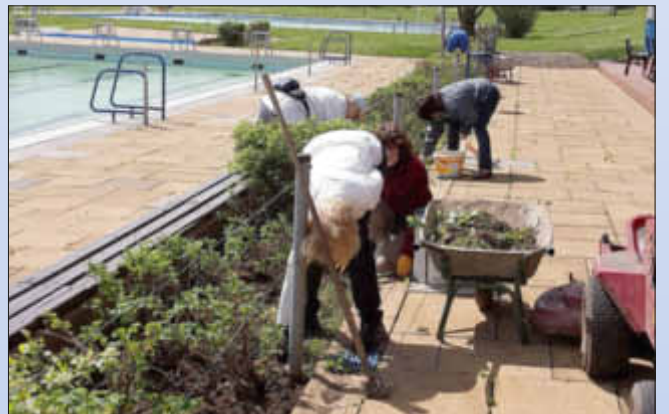
Da würde man am liebsten schon ins Wasser springen!