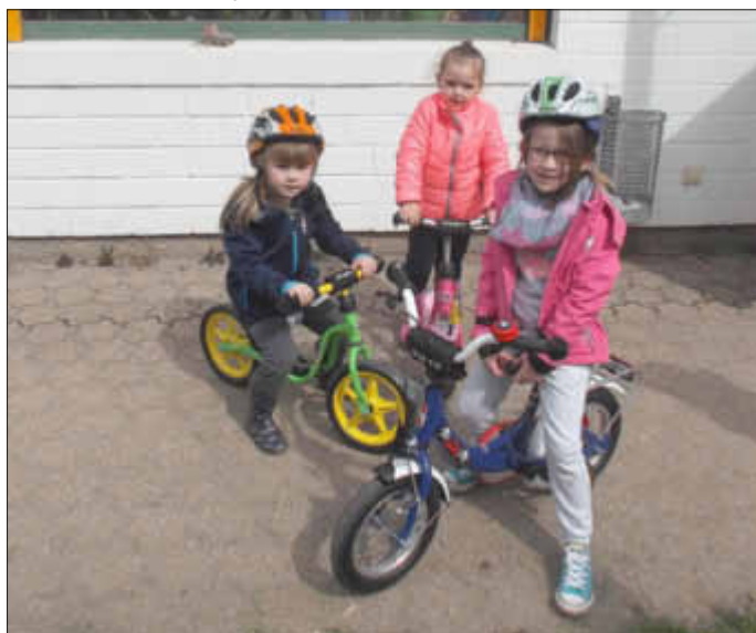
Stolze Kinder auf den neuen Rädern mit den neuen Helmen...

Dies war von Seiten der Kinder ein Dankeschön für die tollen Geschenke. Danach ging es für sie nach draußen, wo jedes Kind die Räder und auch die Helme einmal ausprobieren konnte.