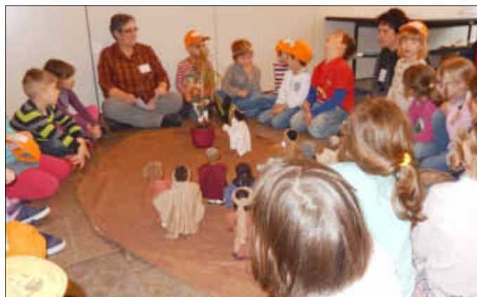
Die Zacchäusgeschichte wird mit Egli Figuren gestaltet.

Als nächstes machten wir uns auf den Weg zu unserem Angebot, dort wurde die Geschichte von Zacchäus mit Egli Figuren erzählt und gestaltet.