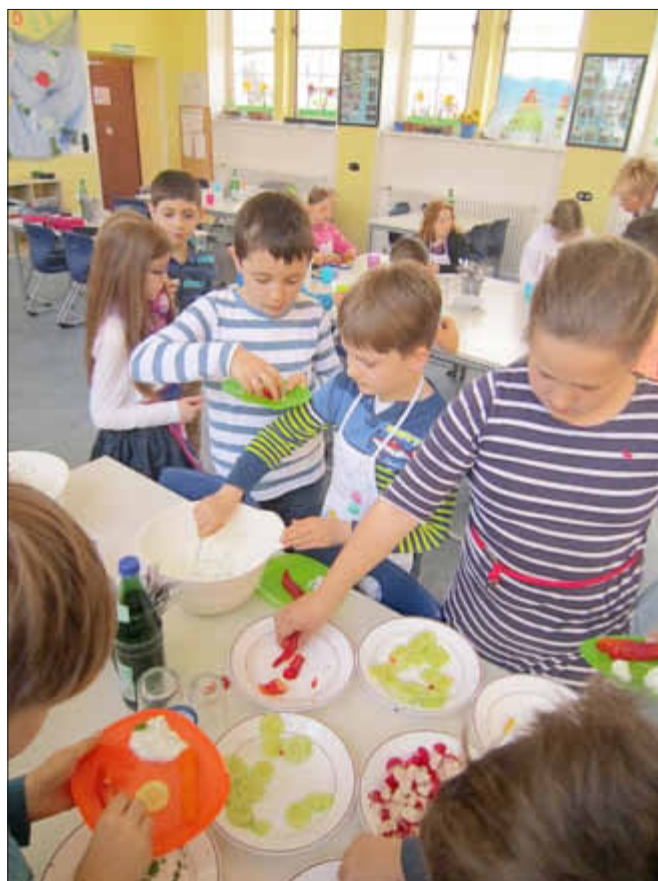
Da greift man gerne zu!