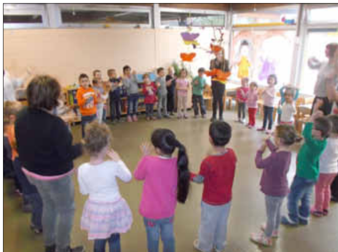
Die Kinder zeigen das Mitmachlied...