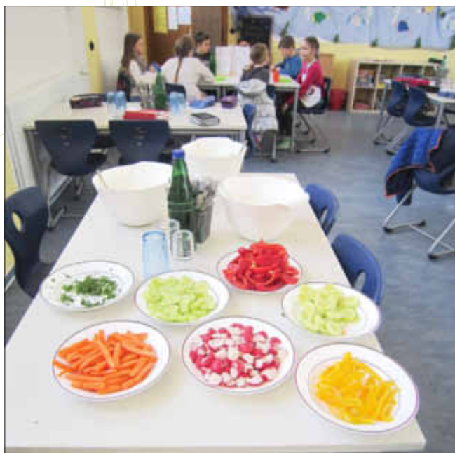
Das Buffet mit Knabbergemüse und Quark sieht sehr appetitlich aus