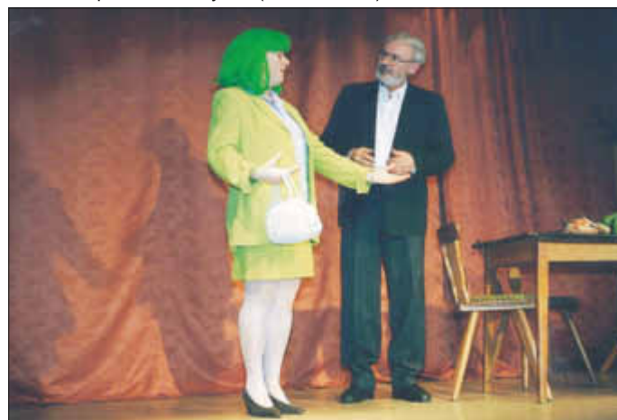
„Pfarrer sucht Haushälterin“ heißt der Sketsch, in dem verschiedene Bewerberinnen beim Pastor vorstellig werden. Ob diese hier wohl die Richtige ist???

Am Freitag, dem 13.05.2016, 19.30 Uhr, laden die Theatergruppe des Madrigalchores Gisingen zusammen mit den Gauspatzen wieder zu einem Theaterabend ins St. Nikolaus-Hospital Wallerfangen ein. Die Veranstaltung findet wie in den vergangenen Jahren in der Cafeteria der Fachklinik für Psychiatrie und Psychotherapie statt. Eintrittskarten (6,- €) können über die Pforte des Hospitals (06831/962-0) oder bei Spielleiter Harry Ehl (06837/74192) reserviert werden.