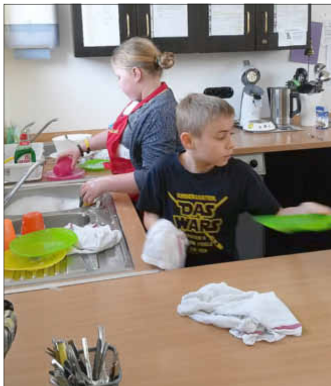
Auch beim Spülen eifrig