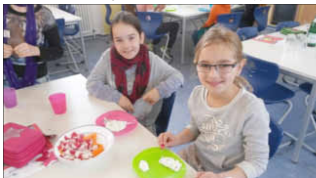
Gemüse macht fröhlich