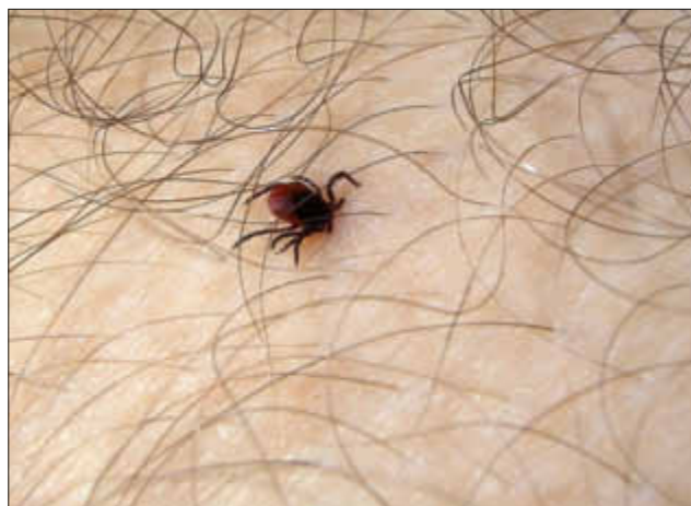
Die Zecke sucht sich einen Platz auf der Haut

Die Borreliose verläuft in 3 Stadien, wobei atypische Verläufe vorkommen. Einige Tage bis wenige Wochen nach einem Zeckenbiss kommt es zunächst zu einem Hautausschlag: eine ringförmige Hautrötung, die sich ausbreitet und vergrößert (sogenannte »Wanderröte«). Ohne Behandlung kann Wochen bis Monate nach dem Zeckenstich, auch nach Verschwinden des Ausschlags, die sogenannte Neuroborreliose auftreten mit Nervenentzündungen, Hirnhautentzündung, starken, oft nächtlichen Schmerzen und/oder Lähmungen. In einem dritten Stadium können Gelenkschwellungen oder Gelenk-Entzündungen auftreten.