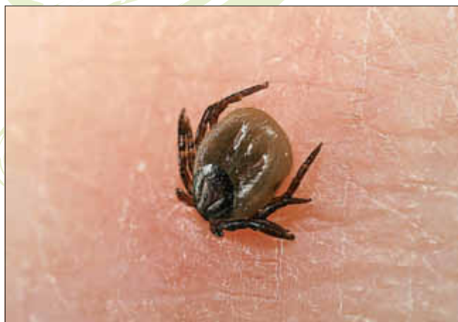
Der Übeltäter in Großaufnahme

Mit dem Frühling werden auch die Zecken wieder aktiv. Bis in den Herbst hinein ist bei Aufenthalt im Freien mit Zeckenbissen zu rechnen.