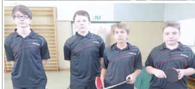
1. Jugend (oben), 2. Jugend