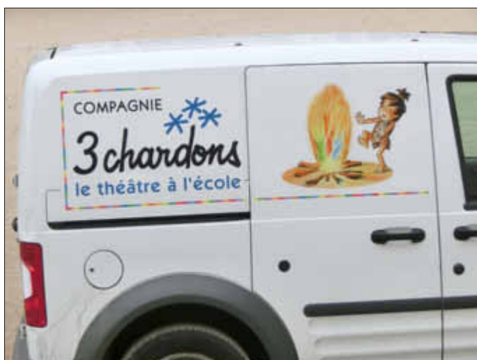
Besuch aus Paris