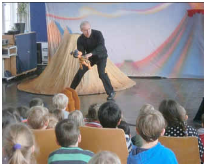
Anga musste viele gefährliche Abenteuer bestehen, bis er das ersehnte Feuer bekam

Dank den Mitteln der EU für das Trilingua-Projekt war das Theater für die Kinder kostenlos. Insgesamt war es eine schöne Bereicherung für die Grundschüler, die nun um eine Erkenntnis reicher sind: Auch wenn ich noch nicht alles verstehe, kann ich Spaß dabei haben. Also bis zum nächsten Jahr! su