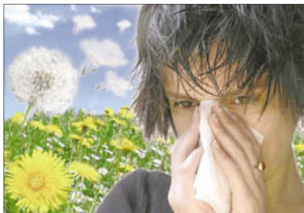
Typisches Symptom: laufende Nase bei Aufenthalt im Freien

Vorbeugend empfehlen sich das Stillen der Babys (gestillte Kinder haben weniger Allergien), Verzicht auf übertriebene Hygienemaßnahmen gerade bei Kindern und Meiden von Schadstoffen (soweit durchführbar)