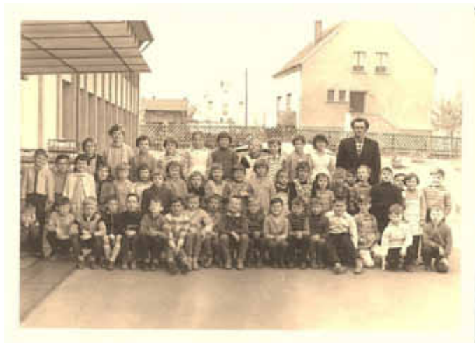
Schuljahrgang 1953/ 54

Nachdem wir 2013 eine gemütliche Wanderung im Elsass erlebten, wollen wir nun auch mit unseren 54ern deren 60ten gebührend feiern. Für die »Neuen 60ziger« haben wir eine Überraschung vorbereitet.