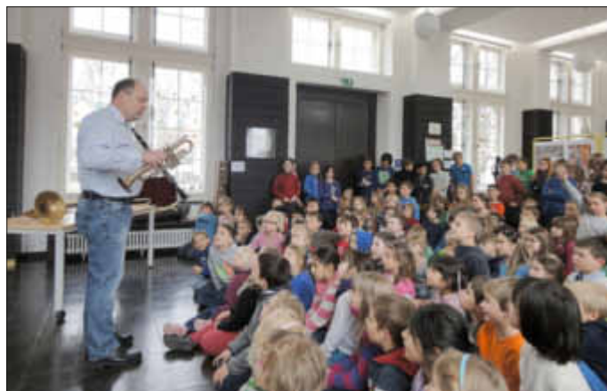
Jedes Instrument wurde einzeln vorgestellt und vorgeführt

Wer den beeindruckenden Elternabend von Concordia Wallerfangen verpasst hat, darf gerne und jederzeit bei einer der immer dienstags (18.00-19.00 Uhr) stattfindenden Proben in der Walderfinja vorbeischaun. hs