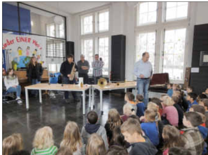
Mit vielen Instrumenten und gleich 6 Musikern rückte der Musikverein an, um seinen Verein vorzustellen