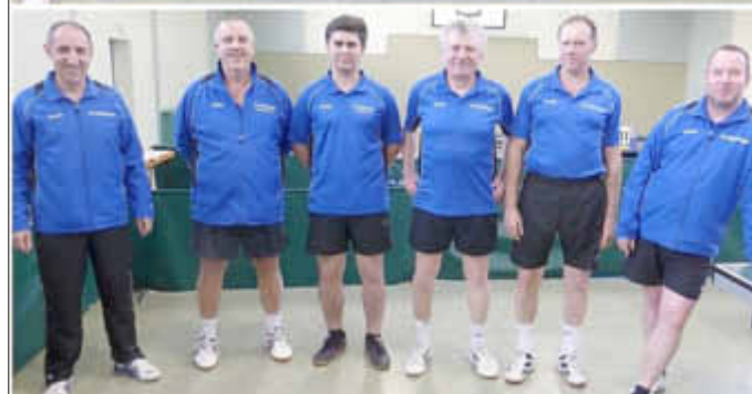
1. Herren (oben), 2. Herren