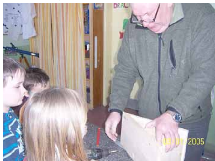
...gebohrt wurde auch!