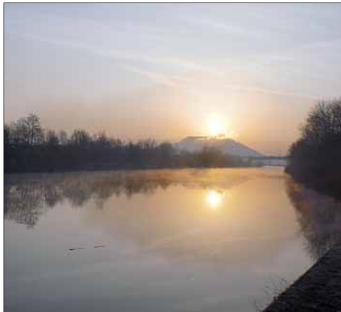
Blick auf die Ensdorfer Bergehalde