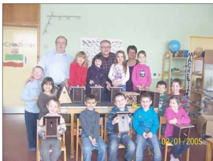
Die Vorschulkinder präsentieren stolz ihre Nistkästen.

Die Kinder und das Team der Kita Ittersdorf