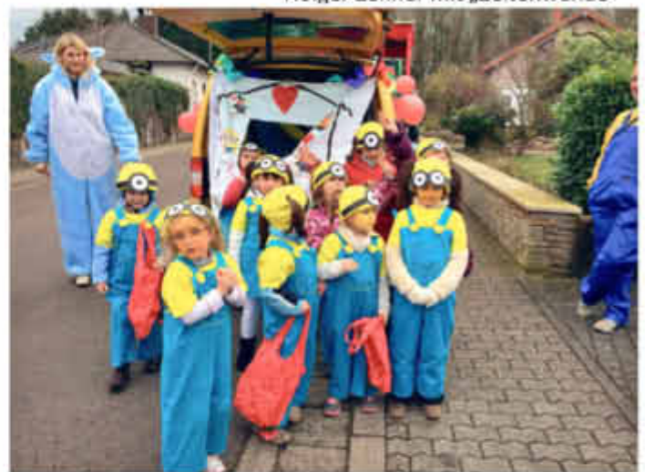
Die „Hansenberger Tanzbärchen“