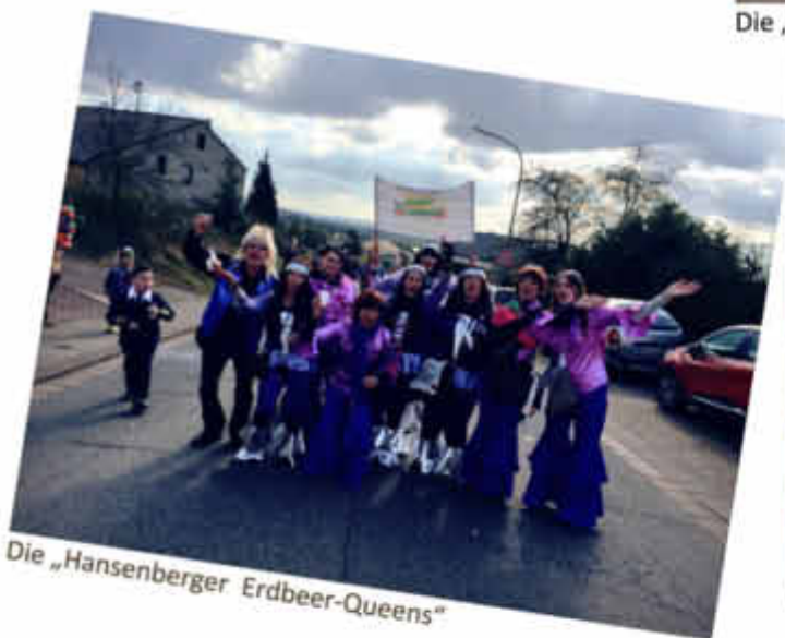
Die „Hansenberger Erdbeer-Queens“