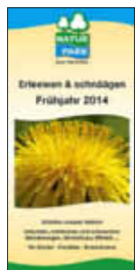
Titelbild des Naturpark-Frühlingsprogramms

Die ersten warmen Frühlingsstrahlen locken raus in die Natur. Gänseblümchen, Narzissen und Buschwindröschen blühen auf und der Bärlauch lässt sich auch schon blicken. Wer kann da schon widerstehen? Das Frühlings-Naturparkprogramm 2014 bietet Kindern, Familien und Erwachsenen interessante Angebote, den Frühling in der Heimat zu entdecken und stimmt auf viele schöne Frühlingstage ein. Kulinarische Naturerlebnisangebote erwarten Sie in den Monaten März bis Mai im Naturpark Saar-Hunsrück.