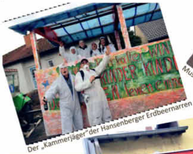
Der „Kammerjäger“ der Hansenberger Erdbeernarren