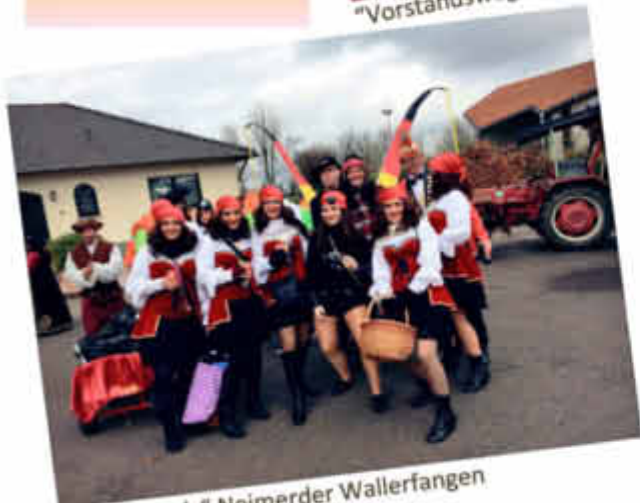
Die „Revivals“ Neimerder Wallerfangen