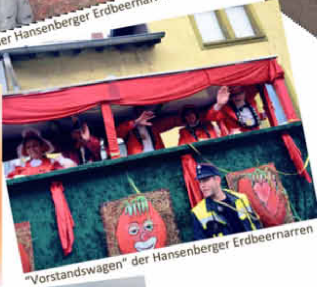
„Vorstandswagen“ der Hansenberger Erdbeernarren

Session 2013/14 Umzug der Hansenberger Erdbeernarren, es war mal wieder ein toller Umzug..... 😊😊😊