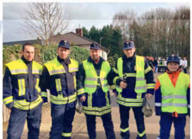
Unterstützung durch unsere Feuerwehr