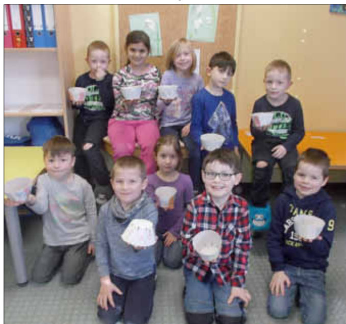
Die selbst gestalteten Osterkörbchen warten darauf, dass der Osterhase einige Leckereien hineinlegt...

An unserer Osterfeier werden wir sehen, ob das geklappt hat. Wir sind gespannt und werden davon berichten!