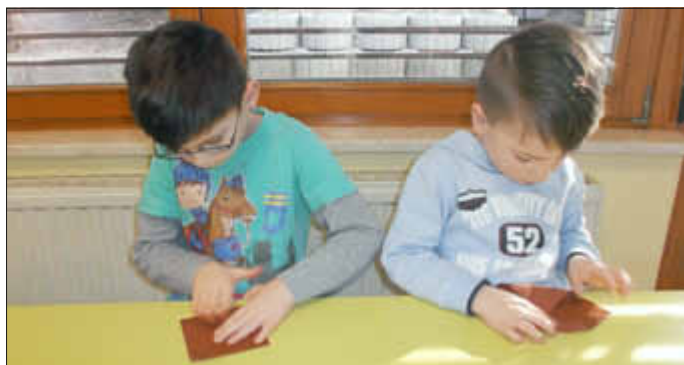
Falten von Osterhasenköpfen...

Die Osterzeit ist immer wieder eine schöne Zeit, die wir auch zusammen mit den Kindern in der Kita genießen. Die Kinder erfahren während dieser Zeit einiges über die Veränderungen, die langsam in der Natur entstehen, aber auch über den religiösen Hintergrund von Ostern. Bei ihnen selbst steht jedoch natürlich die Freude über den Osterhasen im Vordergrund. Deshalb mögen sie Geschichten und Bilderbücher vom Osterhasen, aber auch Fingerspiele, Lieder, Singspiele und Mitmachgeschichten, die von dem Hasen handeln. Außerdem wird die Dekoration von Gruppenräumen und Flur entsprechend österlich angepasst. Die Kinder sind stolz auf ihre selbstgebastelten Hühner, Hasen, Ostereier und mehr und achten sehr darauf, dass diese Dinge ihren Platz im Kindergarten finden.