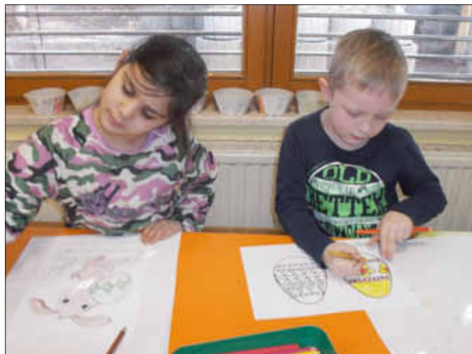
Gerne werden österliche Motive ausgemalt.

Beim Backen von Osterlämmchen werden die Kinder ebenfalls sehr gerne aktiv und helfen voller Elan bei der Zubereitung des Teigs mit. Natürlich schmecken diese Lämmchen dann ganz besonders gut, wenn sie gemeinsam in den Gruppen aufgeteilt und gegessen werden. Auf diese Weise vergeht bei so vielen Angeboten die Zeit ganz schnell, in der die Kinder spielerisch Vieles lernen und noch Spaß dabei haben.