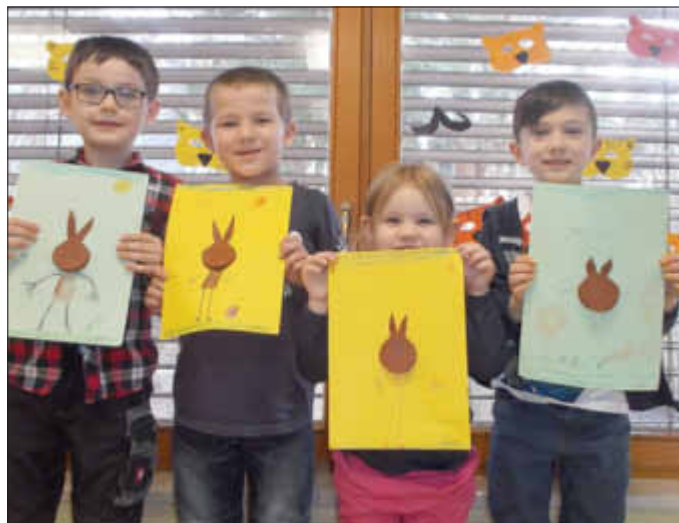
...bis hin zum fertig gemalten Osterhasen.

Beim Backen von Osterlämmchen werden die Kinder ebenfalls sehr gerne aktiv und helfen voller Elan bei der Zubereitung des Teigs mit. Natürlich schmecken diese Lämmchen dann ganz besonders gut, wenn sie gemeinsam in den Gruppen aufgeteilt und gegessen werden. Auf diese Weise vergeht bei so vielen Angeboten die Zeit ganz schnell, in der die Kinder spielerisch Vieles lernen und noch Spaß dabei haben.