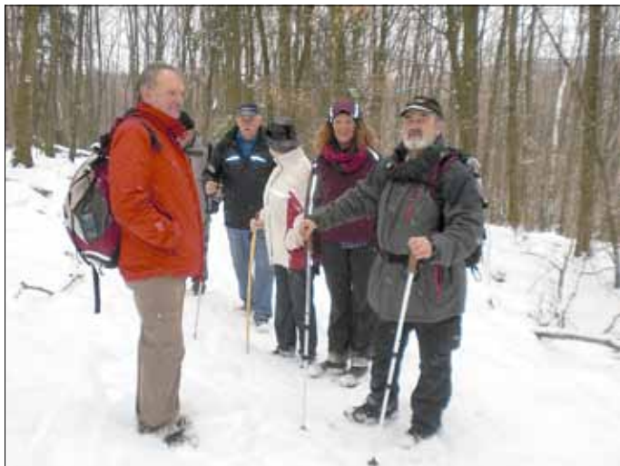
Wandergruppe kurz vor Weiskirchen