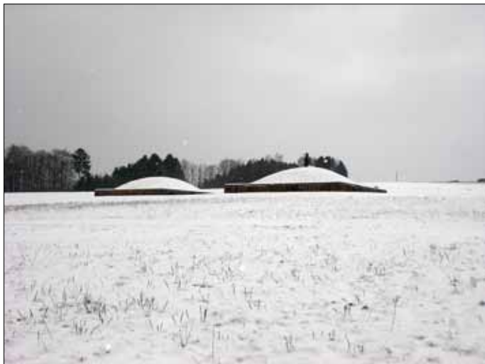
Monumentalgräber bei Kostenbach

2. Die nächste Etappe führt am Sonntag, den 3. März 2013, von Weiskirchen über eine Länge von 28 km nach Mettlach. Auch hier kann wieder die Strecke geteilt werden. Wer will, kann von Britten aus (Wanderparkplatz an der B 268) die restlichen 11 km mitmarschieren. Vermutlich fahren wir mit einem Bus nach Weiskirchen, gehen die 28 km bis Mettlach und fahren mit dem Zug zurück nach Dillingen. Treffpunkt ist um 9.00 Uhr am Rathaus in Wallerfangen.