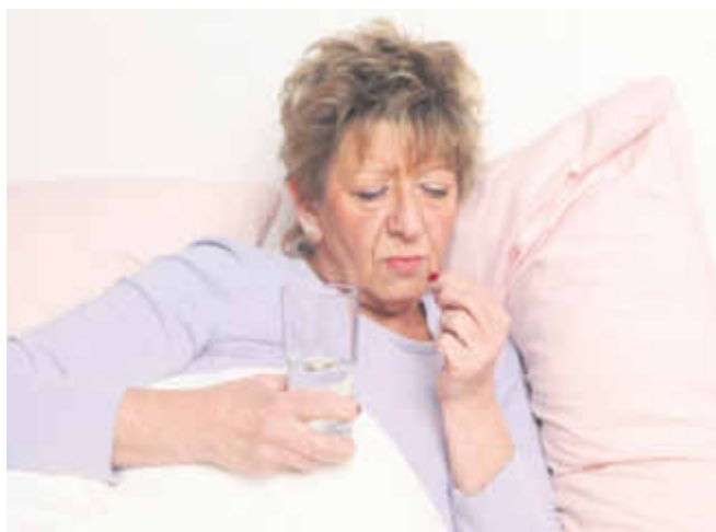
Hände weg vom starken Schlafmittel, wenn nervöse innere Unruhe die Nachtruhe raubt. Sie führen schnell in die Abhängigkeit, betäuben lediglich und bekämpfen die eigentliche Ursache der Schlafstörung nicht: die nervöse innere Unruhe