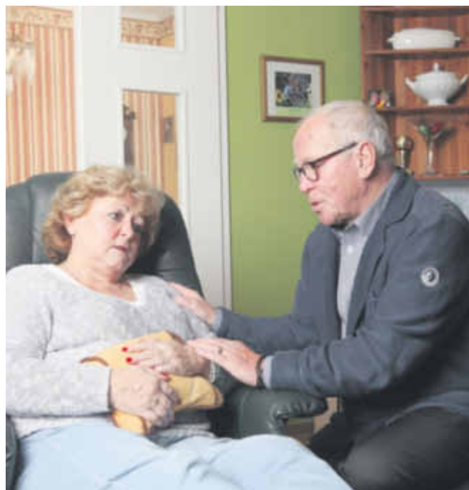
Kennen Sie das – diese Bauch- und Magenbeschwerden, Blähungen, leichte Übelkeit und das unangenehme Völlegefühl nach dem Essen

Für den Akutfall oder häufig wiederkehrende Beschwerden steht Gasteo® (20ml 7,85 Euro, Apotheke, PZN 1073 8439) heute schon in vielen Haus-Apotheken.