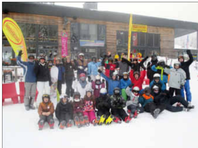
Unsere Skigruppe am Grafenmatt

Mit sehr viel Schnee, sehr kaltem Wetter, aber sehr guter Laune fand die Lehrfahrt bei einer lustigen Skitaufe ihren krönenden Abschluss. Bereits jetzt laufen die Planungen für die nächste Skilehrfahrt 2016.