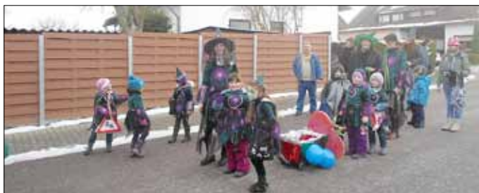
Die Hansenberger Tanzbeerchen beim Umzug in St. Barbara