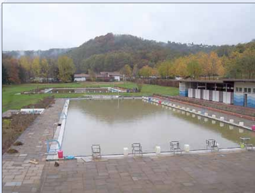
Das Freibad im Winterschlaf

Noch herrschen unfreundliches Winter-Wetter und Minustemperaturen, aber viele ersehnen schon jetzt die Freibadöffnung im Frühling.