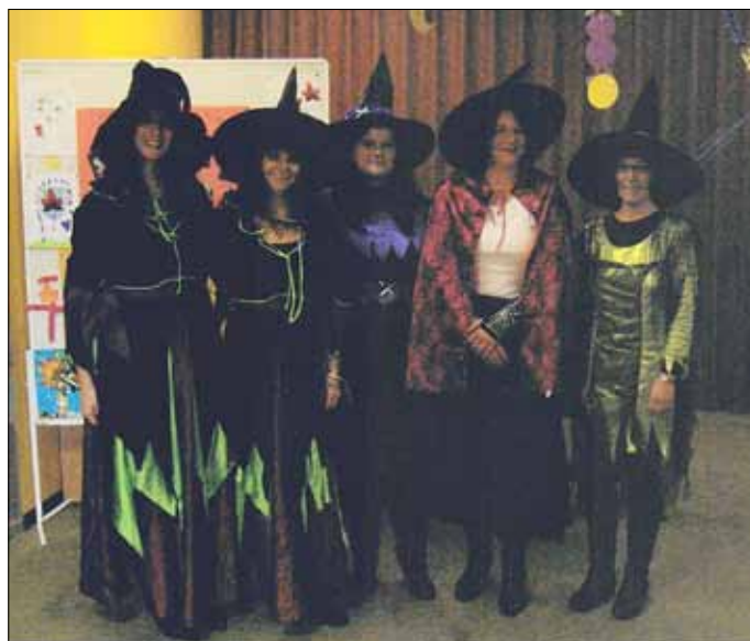
Hexentreff im Kindergarten