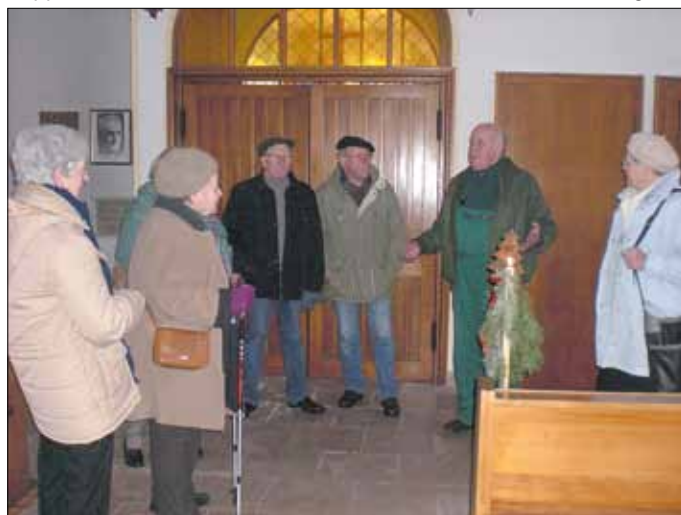
In der Kirche St. Salvator in St. Barbara