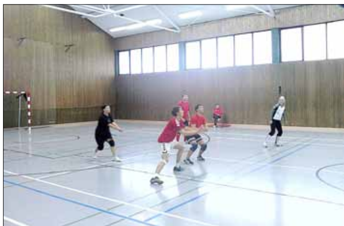
Heimspiel vom 13.01.13 der Hobby-Mannschaft