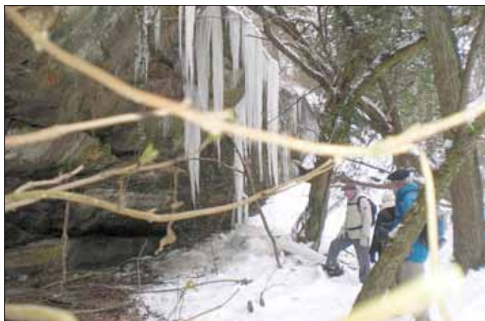
Auf dem Dürener Felsenweg