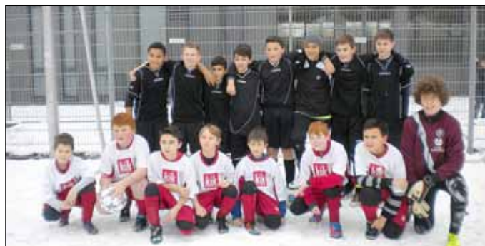
Fußballteams der Schule am Limberg (vorne) und der Gemeinschaftsschule Güdingen