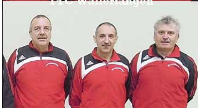
1. Herren und 1. Senioren