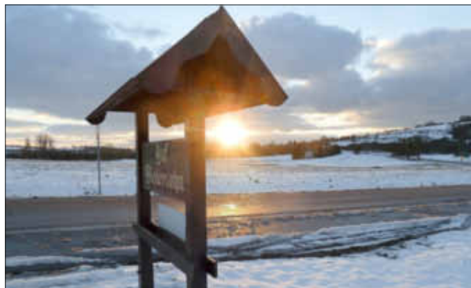
Sonnenuntergang bei Gisingen