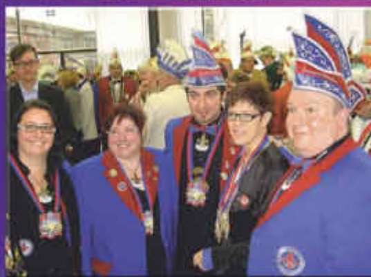
Neujahrsempfang in der Staatskanzlei bei der Ministerpräsidentin Annegret Kramp-Karrenbauer