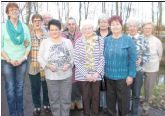
Seniorenwanderer am Saarlarm

2. Die geplante Besichtigung der Weihnachtskrippe in Vaudrechting am 8. 1. 2014 musste abgesagt werden. Aufgrund der Anzahl der Teilnehmer waren zu wenige Autos vorhanden. Deshalb wurde ersatzweise eine Wanderung durch das Neubaugebiet »Vorderst Seitert« angeboten, da noch einige Wanderfreundinnen noch nach günstigem Bauland Ausschau hielten. Schlussrast war in der Fischerhütte am Saarlarm in Wallerfangen. Die Besichtigung der Weihnachtskrippen soll, falls möglich, am 22. 1. 2014, nachgeholt werden.