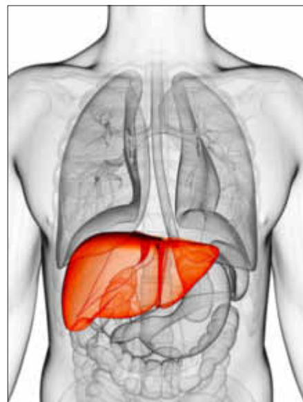
Die Leber liegt im rechten Oberbauch