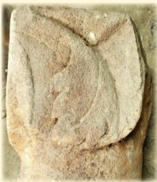
Fränkisches Säulenteil von der Humburg

Im neunten Jahrhundert bot sich endlich auf der Humburg ein hervorragender fester Platz, diesen Kreuzungspunkt der Verkehrswege von einem Felsrücken aus zu überragen.