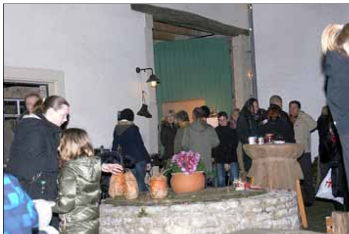
Rommelboozen und Kürbistreff Haus Saargau

Der Erlös des Festes wird zur weiteren Ausgestaltung des neuen Wanderweges »Der Gisinger« verwendet.