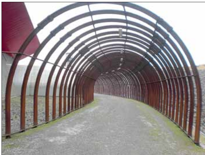
Am Ausgang des Besucherbergwerks »La Mine«

Ein Teil des Lagers trug die Bezeichnung »SS-Sonderlager Hinzert«; dort wurden Arbeiter eingewiesen, die als »Rückfällige, notorische Faulenzer oder Gewohnheitstrinker« länger inhaftiert werden sollten. Am 1. Juli 1940 wurde das Lager durch die Inspektion der Konzentrationslager übernommen, erhielt den Status eines KZ-Hauptlagers und erfüllte seither vielfältige Aufgaben als »Wiedereindeutschungs-«, »Schutzhaft-« und »Arbeitserziehungslager«. Neben »Arbeitserziehungs-Häftlingen« wurden zunehmend politische Gefangene in Hinzert eingeliefert. Ab Mai 1942 wurden vermutlich über 2000 Nacht- und Nebel Gefangene aus Frankreich und den Benelux-Staaten in Hinzert eingeliefert. Vorübergehend waren auch 800 ehemalige französische Fremdenlegionäre deutscher Staatsangehörigkeit untergebracht. Bis zu seiner Räumung 1945 durchliefen das Lager rund 14.000 männliche Häftlinge im Alter zwischen 13 und 80 Jahren.