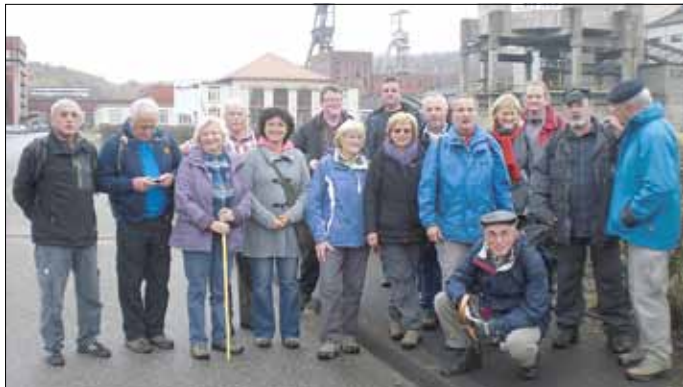
Vor dem Museumsgebäude

Houillères du Bassin Lorrain (HBL) über. Die Ortschaft Rosseln an der Rossel, wurde 1290 gegründet. 1326 erfolgte die Trennung in die zwei Ortschaften rechts und links der Rossel. Heute bildet die Rossel die Grenze zwischen Deutschland und Frankreich. Aber Petite-Rosselle und Großrosseln sind Partnergemeinden. Im Jahr 2006 wurde auf dem Grubengelände das größte Schaubergwerk Frankreichs eröffnet. Das Projekt wurde durch das Département Moselle, die EU, die Kohlegesellschaft Charbonnage de France und einem Zweckverband mit den Gemeinden Forbach und Freyming-Merlebach finanziert. Das Museum im ehemaligen Zechegebäude entstand bereits 1985. Es werden inmitten der originalen Gebäude und Anlagen die Geschichte des Bergbaus, seine technische Entwicklung und das Leben der Bergleute gezeigt. Sehr interessant.