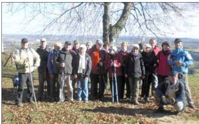
Auf dem Vauban-Steig oberhalb der Teufelsburg

2. Am Sonntag, dem 28. Oktober 2012, fand die Wanderung auf dem neuen Wanderweg der Stadt Saarlouis statt. Der »Vauban-Steig« hei ßende Weg führte die 24 Wanderer auf 15 km durch Wald und Wiesen rund um den Truppenübungsplatz in Beaumarais. Mittagsrast war in der Schutzhütte »In der Rosch« vor der Teufelsburg. Der Steig ist auf den Flächen der Stadt Saarlouis fertig.