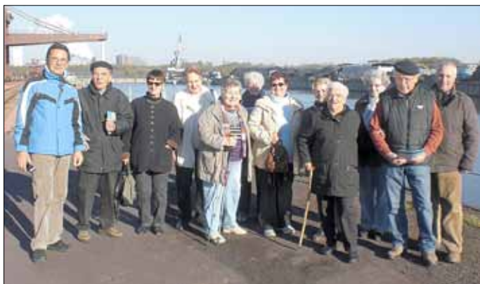
Im Dillinger Hafen

3. Die Seniorenwanderung am Mittwoch, dem 31. Oktober 2012, führte in den Dillinger Hafen. Dieser Hafen ist der mit Abstand bedeutendste Umschlagplatz an der Saar. Er gehört zu den modernsten in Europa und zu den zehn umschlagstärksten in Deutschland. Sein Jahresumschlag liegt bei bis zu 4 Millionen Tonnen. Ausgestattet ist der Hafen mit einem 1.050 Meter langen Kai, einem 46 Meter breiten Hafeneingang und einem bis zu 130 Meter breiten Becken, das durch seine beiderseits senkrechten Uferwände problemlos zu befahren ist.