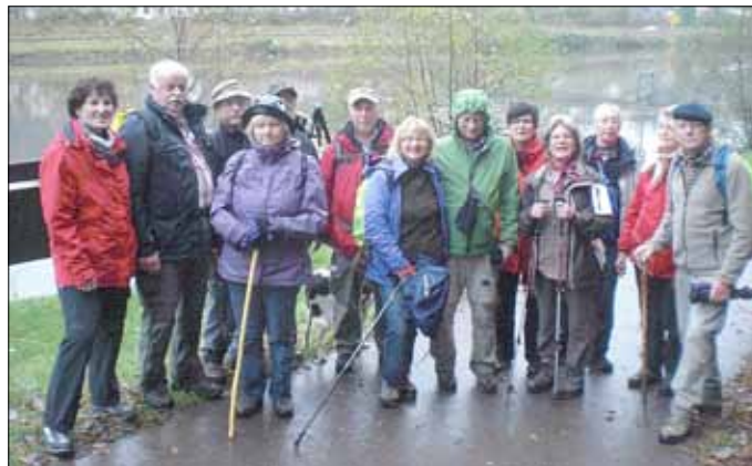
Auf dem Rückweg von der Käshütt kurz vor Saarlöcherbach