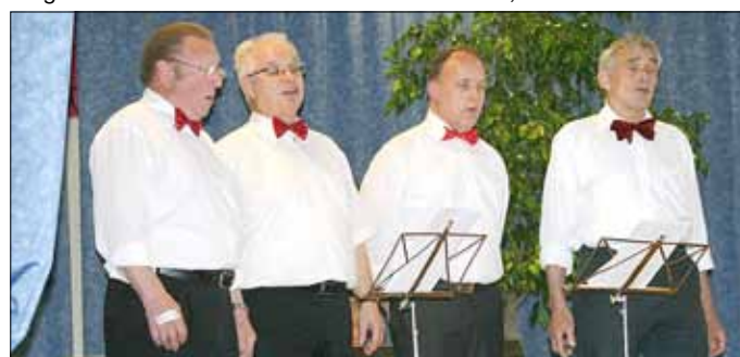
Als »Weltathleten« sind die Gauspatzen in diesem Jahr dabei und laden uns ein zu einer »Rundreise über den Gau«

Anschließend laden die Gauspatzen zu einer musikalischen »Rundreise über den Gau« ein, bevor der Zuschauer im letzten Beitrag »Bei Jääps gefft gedählt« Zeuge einer Erbschaftsangelegenheit wird. Die älteste Tochter des Hauses hat ihre drei Schwestern eingeladen um das Erbe der verstorbenen Eltern zu teilen. Ob dabei die hochgesteckten Erwartungen auf ein ordentliches Erbe erfüllt werden, bleibt abzuwarten.