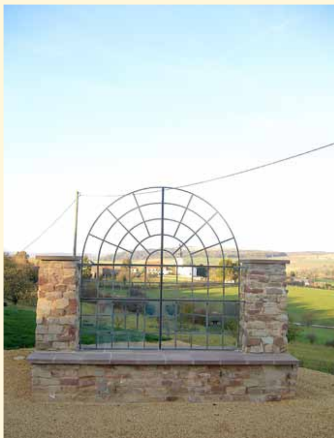
Die Grenzblickfenster: Vom Fenster auf französischer Seite geht der Blick zur nahezu identischen Installation auf deutscher Seite