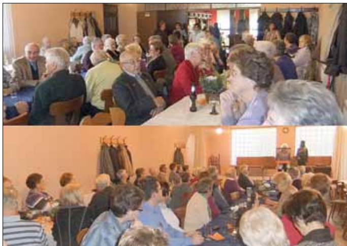
Seniorennachmittag in Gisingen