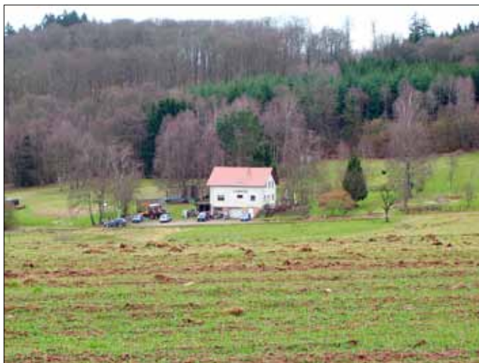
Die Käshütt in der Käsgewann