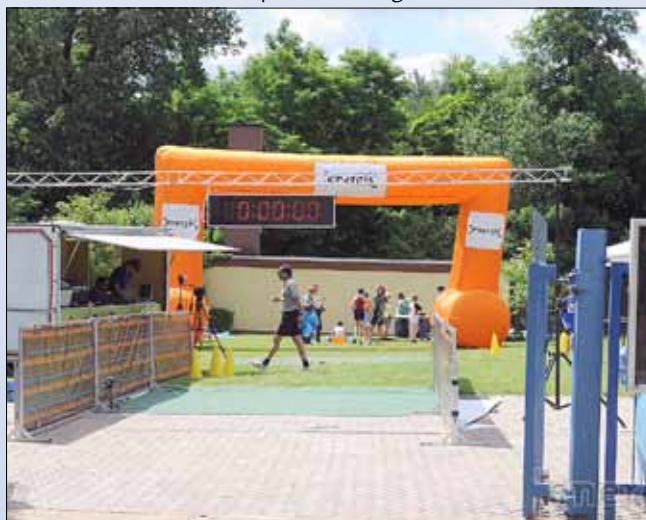
Das Ziel der Läufer

Gönnen auch Sie sich ein paar Ferientage im Freibad!