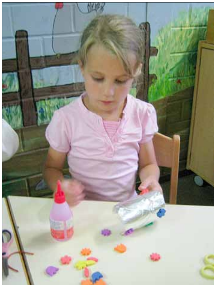
Mein königlicher Armreif