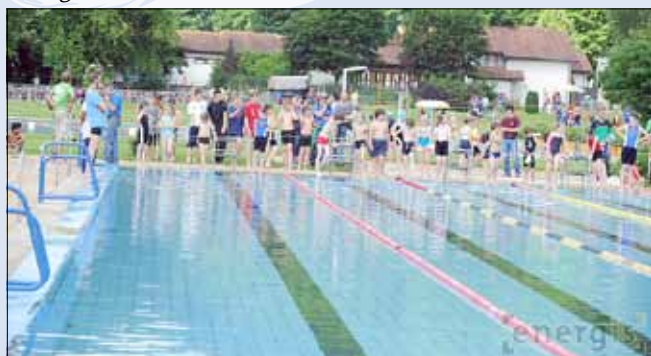
Vor dem Schwimmstart

Auch in diesem Jahr fanden die saarländischen Schüler-Triathlon-Meisterschaften wieder im Wallerfanger Freibad statt. Rund 300 Schüler zwischen 7 und 15 Jahren nahmen an der 9. Auflage des Wettbewerbs teil.