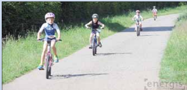
Radstrecke in der Umgebung des Freibads

Die Schüler mussten 200 Meter schwimmen, 3 Kilometer Radfahren und 1000 Meter laufen.