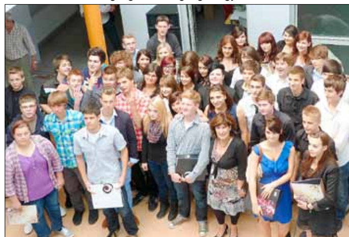
Die Abschlusschüler der ERS Wallerfangen

Und von den 34 Realschülern/innen mit mittlerem Bildungsabschluss erwarben 11 die Übergangsberechtigung zur gymnasialen Oberstufe.