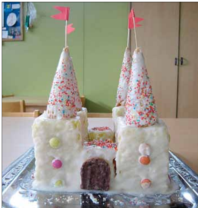
Der leckere Ritterburg-Kuchen

Am vergangenen Donnerstag übernachteten elf der insgesamt dreizehn Kinder, die in diesem Sommer eingeschult werden, mit einigen Erzieherinnen in der Kita. Mit Schlafsäcken, Luftmatratzen, Kuschtieren und Taschenlampen ausgerüstet, waren alle pünktlich erschienen. Nachdem jedes Kind und natürlich auch die Erzieherinnen einen Schlafplatz ausgewählt hatten, starteten die ersten Angebote für die Kinder. Unter dem Motto „Märchen“ wurden Armbänder und -reife, sowie Trinkkelche aus „Silber“ gestaltet und mit bunten „Edelsteinen“ verziert. Es wurden Spiele gespielt, ein Märchen wurde erzählt und von den Kindern mit gestaltet. Außerdem startete noch ein Malwettbewerb, bei dem alle Kin-