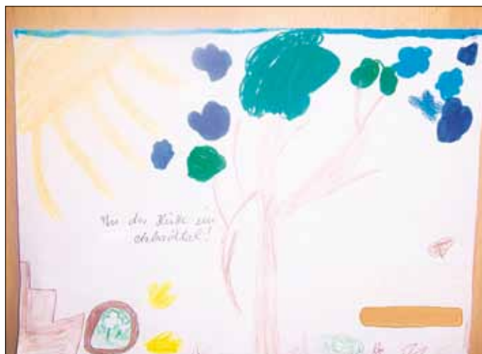
Unsere Hütte im Wald