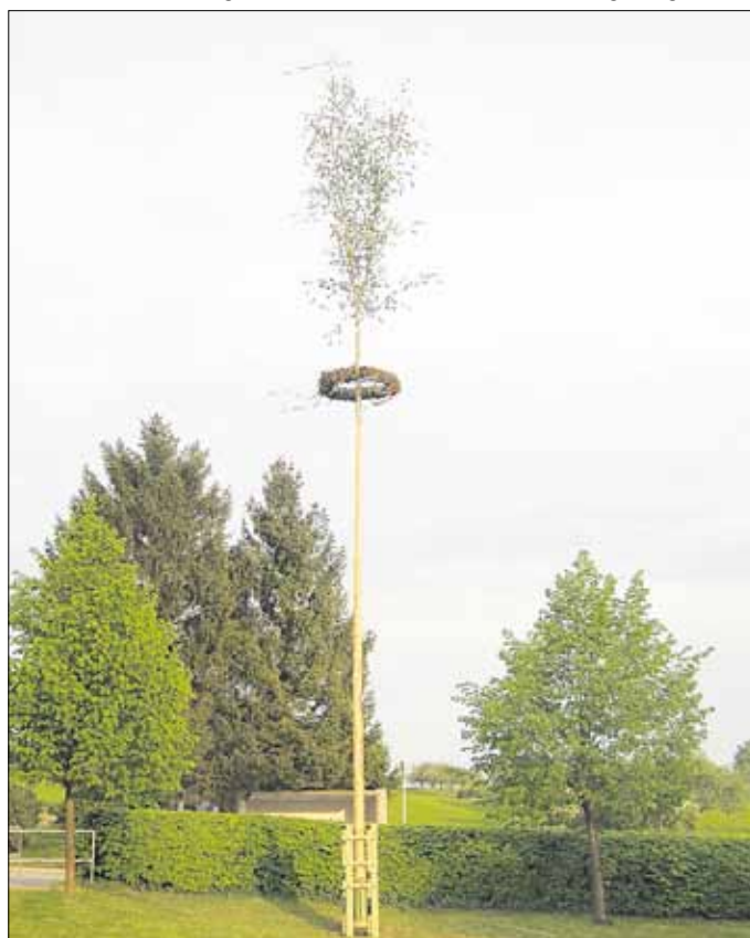
30.04.2012: Maibaumsetzen in Kerlingen

Die Kerlinger Bevölkerung ist zum anschließenden gemütlichen Beisammensein herzlich eingeladen. Für das leibliche Wohl wird gesorgt sein.