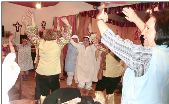
Stimmung beim Faasendnoomettach

Auch in diesem Jahr gibt es wieder einen bunten Faasendnoomettach der Frauen- und Müttergemeinschaft.