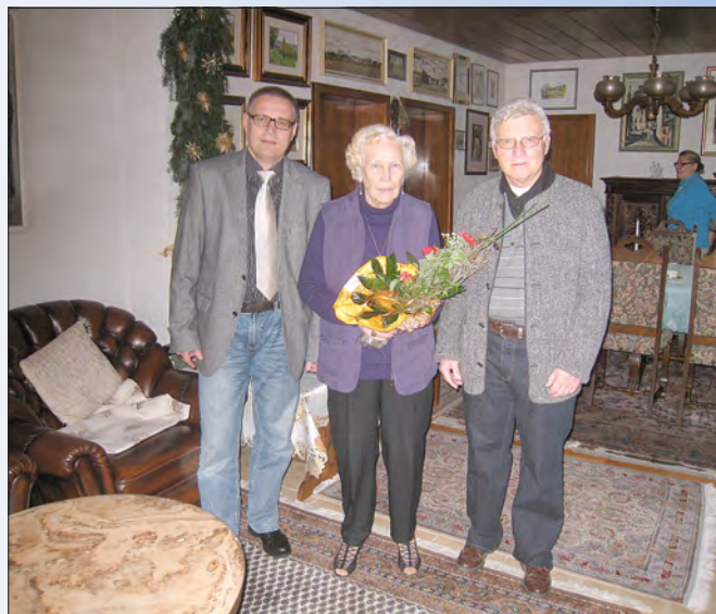
Die Gemeinde Wallerfangen gratuliert sehr herzlich!