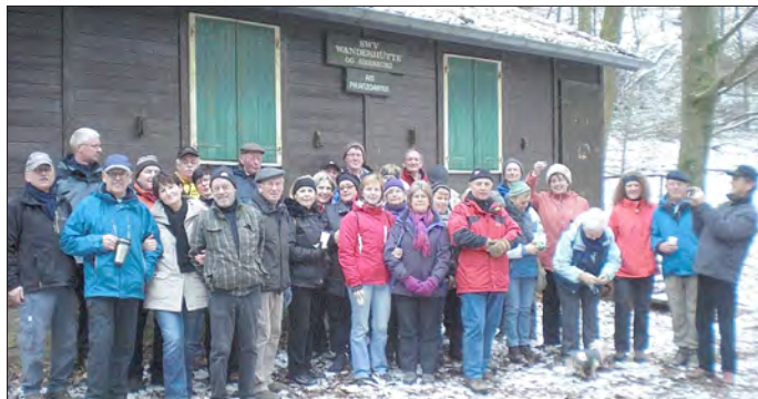
An der Saarwald-Vereinshütte am Pflanzgarten

Wir bitten um Anmeldung bis spätestens 22.01.2013 bei Uschi Balge.