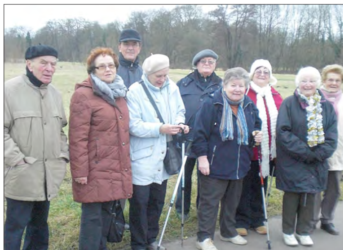
Senioren am Saaraltarm

1. Am Mittwoch, dem 9. Januar 2013, fand die erste Seniorenwanderung für dieses Jahr statt. 10 Wanderer ließen sich von der Kälte nicht zurückhalten und wanderten vom Rathaus über Altpfarr in die Fischerhütte.