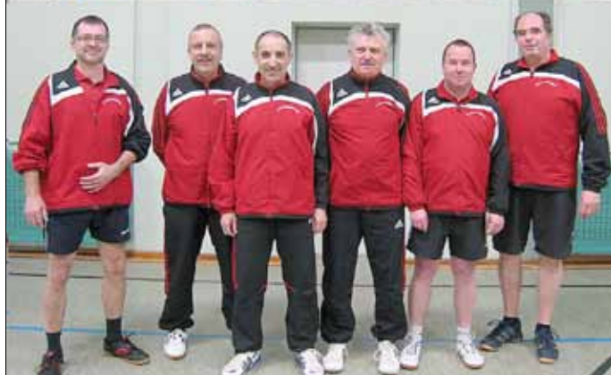
Oben die 2. Herren, unten die 1. Herren