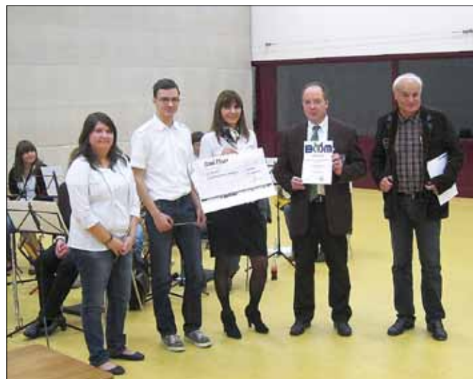
Die stolzen Preisträger des Musikverein Wallerfangen zusammen mit Vertretern des BSM und der Bank1 Saar

Zum Jahresabschluss wünschen wir all unseren aktiven und inaktiven Mitgliedern schöne Weihnachtstage und einen guten Rutsch ins neue Jahr.