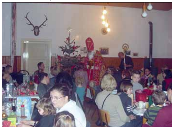
Nikolausfeier in Leidingen

Die diesjährige Nikolausfeier in Leidingen fand am Samstag, dem 8. Dezember, im Leidinger Dorfgemeinschaftshaus statt. Ab 16 Uhr fanden sich viele Kinder mit ihren Eltern und Großeltern ein, um auf den Nikolaus zu warten. Nach Einbruch der Dunkelheit war es dann soweit: Der Nikolaus erfreute uns mit seinem Besuch und hat für jedes Kind eine reichlich gefüllte Nikolaustüte mitgebracht. Einige Kinder haben auch tolle Gedichte vorgetragen. Für Groß und Klein haben wir Gebäck und Kuchen, Brezeln und belegte Brötchen sowie verschiedene kalte und warme Getränke angeboten.