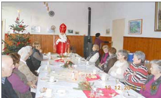
Der Nikolaus beim Seniorennachmittag in Leidingen