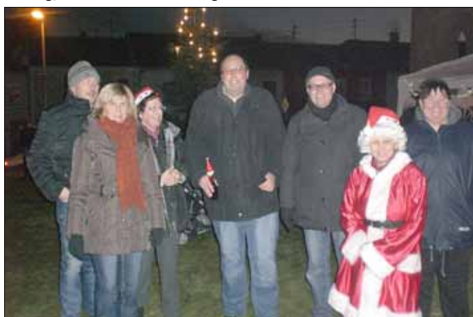
Eröffnung des Weihnachtsmarktes

Freitag, 25.01.2013 und Freitag 01.02.2013