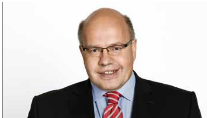
Gastredner Peter Altmaier