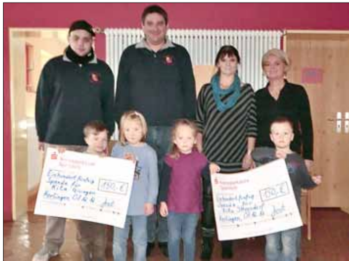
Scheckübergabe an die beiden Leitungen

Für die Feuerwehr Lbz. Kerlingen ist es selbstverständlich, neben ihrer Hauptaufgabe, dem Brandschutz, auch gesellschaftliches und soziales Engagement zu zeigen. So wurden bereits in 2011 der Gesamterlös aus dem Verkauf von Speisen und Getränken, sowie die Spenden anlässlich des Martinsumzuges aus den Jahren 2010 und 2011 an das Kinderheim Wallerfangen gespendet.