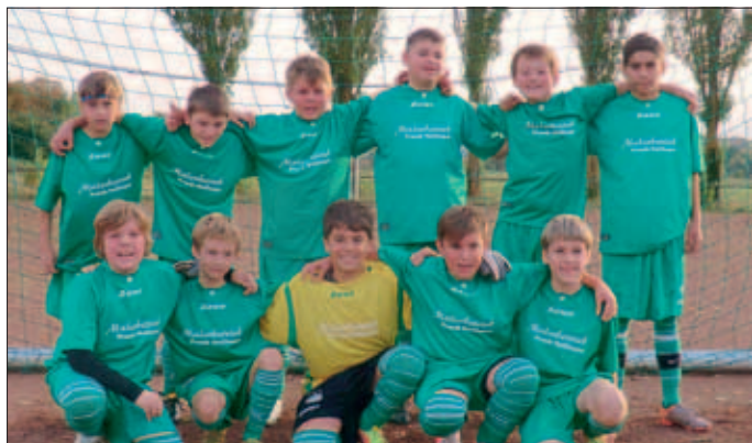
D7-Jugend VfB Gisingen

In den Herbstferien finden keine Spiele statt.