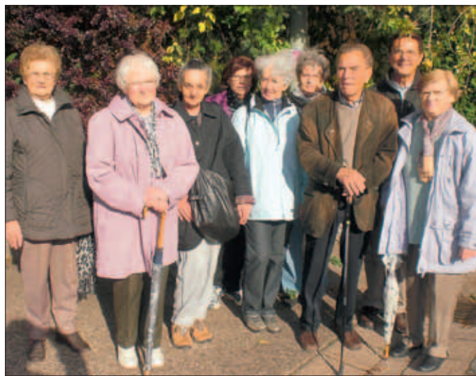
Die Senioren auf dem „Gisinger“

1. Am Mittwoch, dem 17. Oktober 2012, fand die Seniorenwanderung auf dem neuen Wanderweg in der Gemeinde Wallerfangen, »Der Gisinger«, statt. Die Senioren bewältigten eine Teilstrecke auf dem schönen Weg. Schlussrast war dann im »Saargau-Dorfladen« in Gisingen.