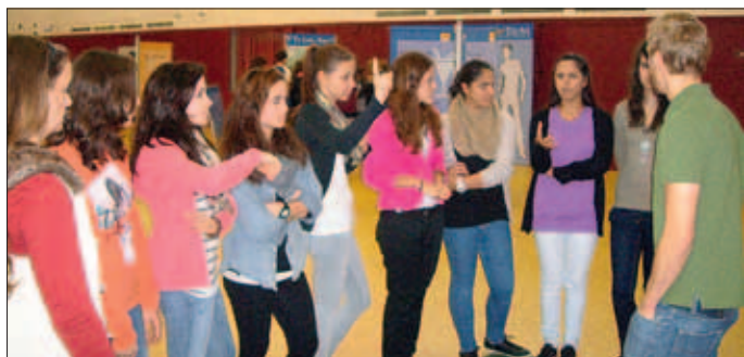
Schülerinnen der Klasse 9.2 beim Klarsicht Parcours

Der „Klarsicht Parcours“ ist ein präventiver Mitmachparcours zu Tabak und Alkohol. Unseren Schülerinnen und Schülern bot sich die Gelegenheit gefahrlos die Auswirkungen der beiden Genussmittel am eigenen Körper zu erfahren. Die Veranstaltung, die an zwei Tagen in der Walderfingia stattfand, machte den Schülerinnen und Schülern der Klassenstufen 8 bis 10 viel Spaß.