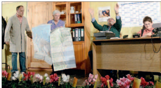
Die Theatergruppe Gisingen freut sich jetzt schon auf euren Besuch!

Der Vorverkauf für die Veranstaltung in Kerlingen beginnt Anfang November an den bekannten Vorverkaufsstellen; in der St. Elisabeth-Klinik ist wie gewohnt der Eintritt frei, stattdessen wird um eine Spende für den Förderverein der Klinik gebeten.