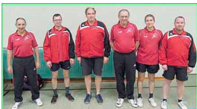
1. Mannschaft und 2. Mannschaft des TTC Wallerfangen

Viel Spaß wünscht Euch der TTC Wallerfangen!