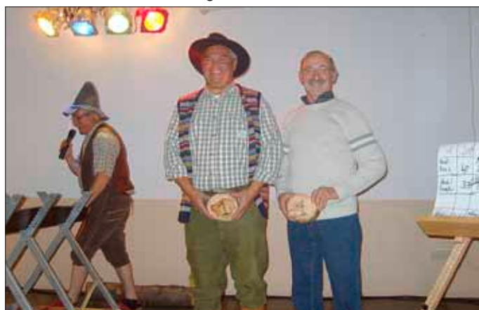
Das Siegeream des Wettsägens mit der Drummsäge

Beim Wettsägen mit der Drummsäge winken originelle Preise für die Siegereams. Der Sonntag beginnt um 10.00 Uhr mit dem Frühschoppen, Mittagessen gibts ab 12.00 Uhr. Sämtliche Speisen werden auch tagsüber bis in die Abendstunden gereicht.