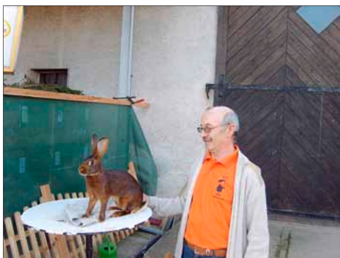
Sieger „Bester Rammler 2011“

Insgesamt werden wieder ca. 80 Tiere in Norri's Scheune präsentiert. Tombola, Mittagessen am Sonntag, Kaffee und Kuchen sind ebenfalls im Programm. Näheres hierzu folgt.