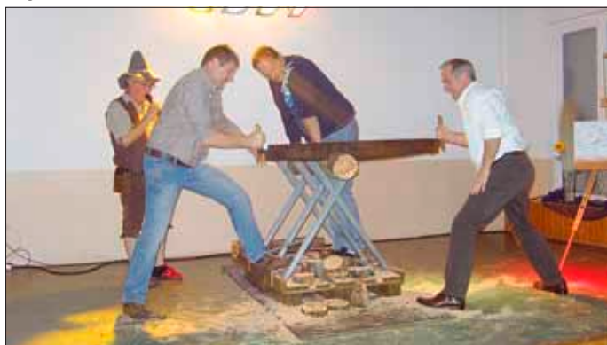
Preiswettsägen mit der Drummsäge

Das Samstagabendevent ist wieder das Preiswettsägen mit der Drummsäge - Frauenteam dürfen ebenfalls an dem Wettbewerb teilnehmen.