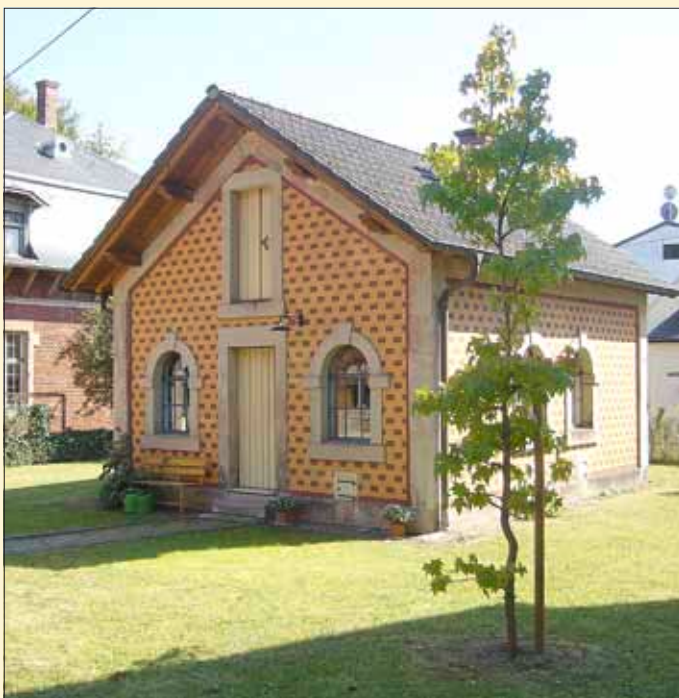
Ein architektonischer Glücksfall: Das Hühnerhaus in Wallerfangen

Das ehemalige Hühnerhaus in Wallerfangen, Hauptstraße 58, zählt wohl zu den bemerkenswertesten Kleinbauten auf der im Saarland geführten Liste der Kulturdenkmäler. „Pittoresk“ ist nur ein sehr unzulänglicher Ausdruck für den zuckersüßen Anblick, den es von außen bietet. Seine nahe Lage zur Sonnenstrasse und sein erhöhter Standort ließen es im Ortsbild stärker hervortreten, wäre da nicht der überwältigende und jede Aufmerksamkeit bindende Kreuzungsbereich der abknickenden Vorfahrt in Richtung St. Barbara.