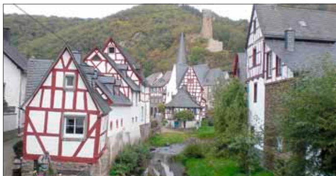
Blick auf die Monrealer Altstadt