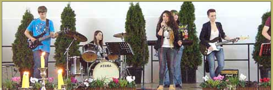
Die Band der ERS Wallerfangen