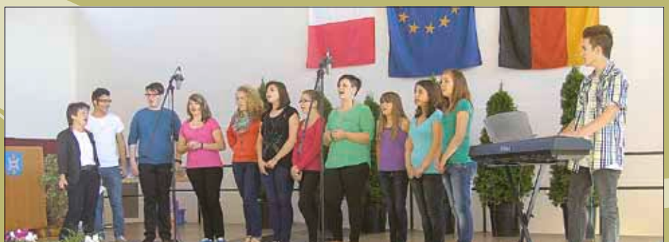
Der Chor der ERS Wallerfangen