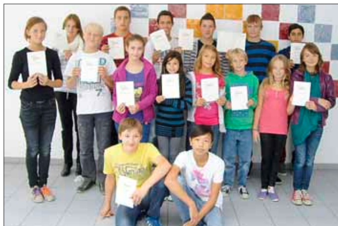
Die sportlichsten Schüler der ERS Wallerfangen mit ihren Ehrenurkunden

Am Dienstag, den 11. September 2012 fand bei angenehmen Temperaturen das alljährliche Sportfest Schule am Limberg im Parkstadion in Dillingen statt. Die Schülerinnen und Schüler der Klassenstufen 5 bis 10 zeigten ihr sportliches Können in den leichtathletischen Disziplinen. Auf dem Programm stand: Kurzstreckenlauf mit 50/75 oder 100m-Lauf, Weitsprung, Schlagballweitwurf oder Kugelstoßen und die Ausdauerstrecke mit 800m für die Mädchen und 1000m-Lauf für die Buben. Aus diesen Disziplinen wurden die Leistungspunkte der 3 besten Disziplinen addiert. Insgesamt konnten sehr gute Leistungen gezeigt werden, was 100 Siegerurkunden und 20 Ehrenurkunden bewiesen.