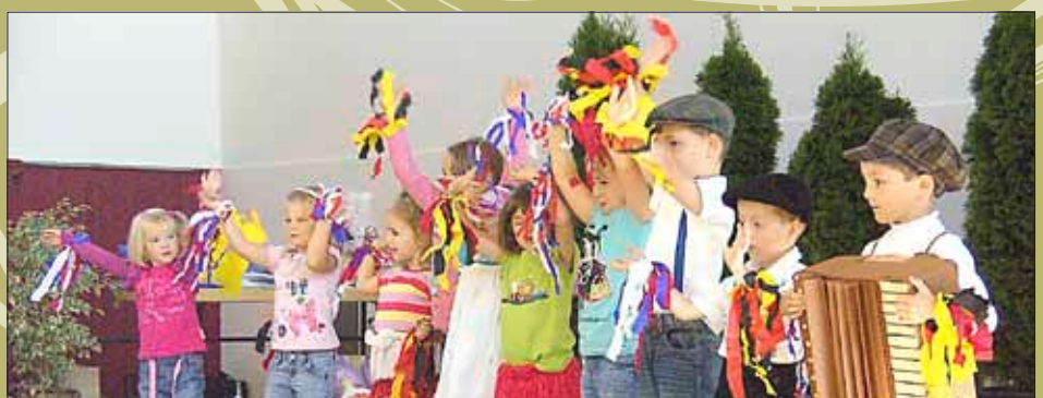
Kinder des Kindergartens Ittersdorf