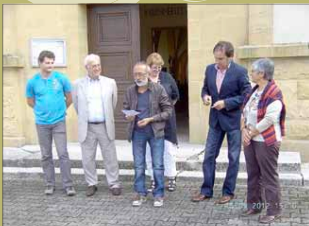
Begrüßung durch den stellvertretenden Bürgermeister von Heiningen