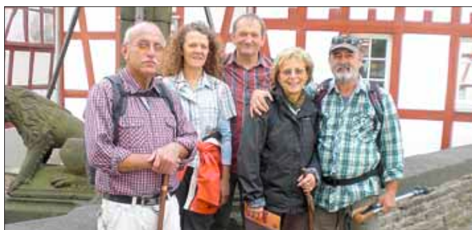
Auf der mittleren Brücke