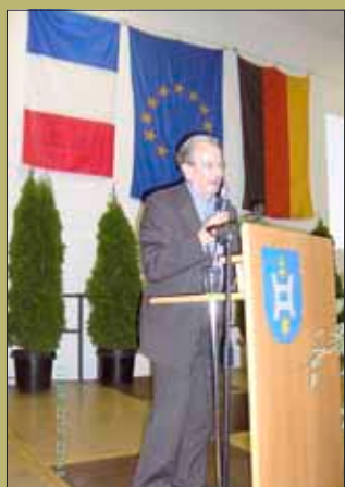
Monsieur Claude Villeroy de Galhau