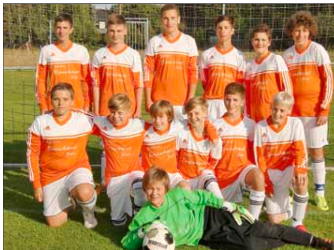
C-Jugend VfB Gisingen am 19.09.2012

30.9. B-Jugend VfB Gisingen - SSV Überherrn 10.30 Uhr