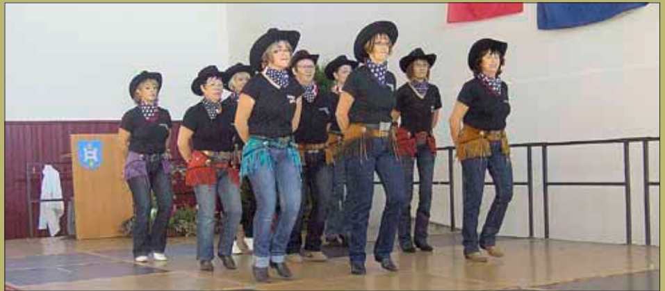
Die Country Tanzgruppe aus St. Vallier