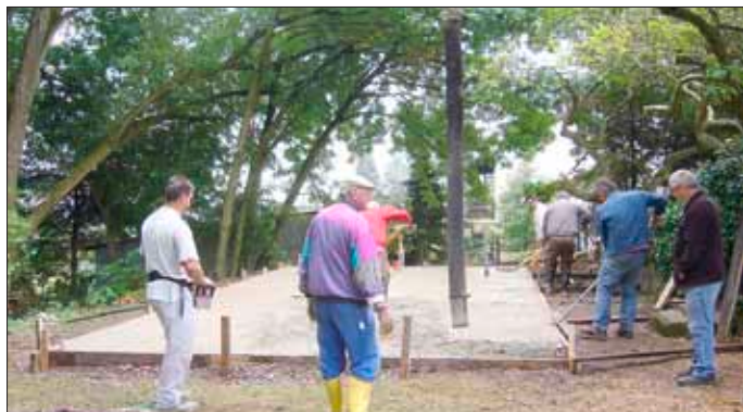
Die Bodenplatte für die Schutzhütte ist fertig