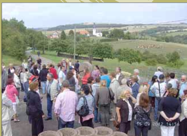
Empfang an der Kirche in Französisch Leidingen