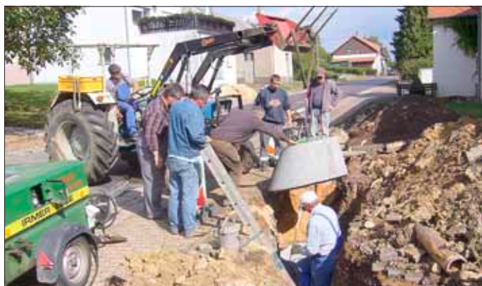
Ein Putzschacht wird eingebaut