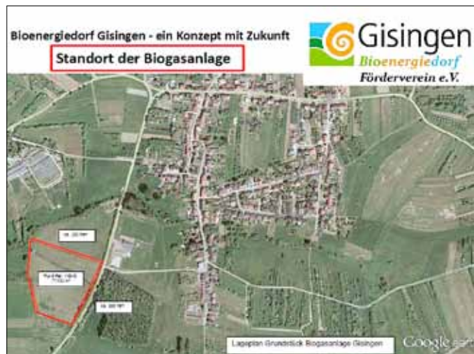
geplanter Standort Biogasanlage Gisingen

Die vorläufige Planungsphase betrachtet im ersten Bauabschnitt die Straßen: Zum Scheidberg, Gaustraße und Teile des Oberlimbergerweges. Derzeit ist der Verein Bioenergiedorf Gisingen e.V. in engem Kontakt mit Firmen, um gemeinsam eine Wirtschaftlichkeitsberechnung zu erstellen. Wenn wir Ihr Interesse an der Idee geweckt haben, können Sie sich gerne an uns wenden. Wir treffen uns montags alle 14 Tage im Gasthaus Bauer, nächster Termin ist am 24.09.2012.