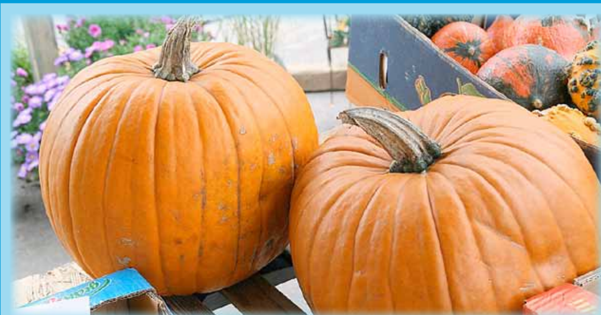
Ideal im Herbst: Kürbisgerichte

Gesund essen bedeutet: reichlich Obst, Gemüse und Salat essen, Vollkornprodukte verwenden, fettarme Milchprodukte bevorzugen, möglichst 1-2mal pro Woche Seefisch, wenig Fleisch und Wurst und wenig Süßigkeiten essen.