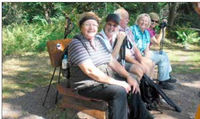
2. Teil der Wandergruppe auf dem Litermont