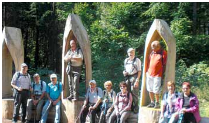
1. Teil der Wandergruppe auf dem Litermont