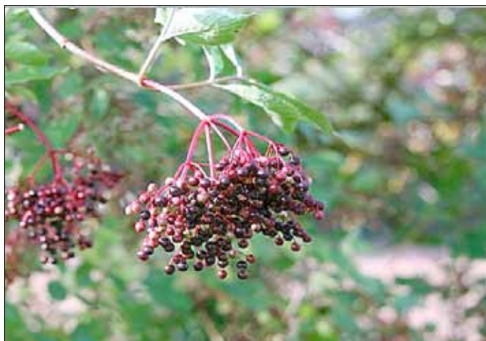
Holunderreife im Naturpark

Am Sonntag, 23. September, 10 bis 13 Uhr , führt der Naturpark Saar-Hunsrück eine Wanderung mit Praxisseminar „Gesundheit mit der Kraft des Holunders“ im Naturpark-Dorf Gisingen für Kinder und Erwachsene durch. Der Kräuterpädagoge Guido Geisen stellt die Powerpflanze für das Immunsystem vor. Die Germanen brachten zu Ehren der Göttin Holda oder Holla, wie im Märchen der Brüder Grimm Frau Holle, ihre Opfer unter dem Holunderbaum dar. In den Naturpark-Bauergärten finden wir heute noch oft den Holunderstrauch. Der Holunder ist ein bekanntes Volksheilmittel bei Erkältungen. Die Beeren können zu leckerem Saft verarbeitet werden. Der frische Saft wird empfohlen zur Heilung von Rheuma, Neuralgien und Ischias, der heiße Saft wird bei Erkältungskrankheiten eingesetzt. Die Rinde, Wurzel und Blätter wirken harntreibend. Der Referent gibt wichtige Tipps zur Ernte, Wirkungsweise und zur Botanik des Strauches. Im Anschluss an die Wanderung wird ein „Holunderlikör“ zubereitet. Als Ausrüstung werden festes Schuhwerk, witterungsangepasste Kleidung und ein Korb zum Sammeln empfohlen. Die Teilnahmegebühr beträgt 10 Euro pro Teilnehmer. Treffpunkt ist die Naturpark-Infostelle Haus Saargau in Wallerfangen-Gisingen. Eine frühzeitige Anmeldung wird bei der Geschäftsstelle des Naturparks Saar-Hunsrück in Hermeskeil, Telefon 06503/9214-0 empfohlen.