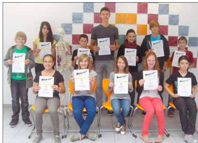
Die Siegerinnen und Sieger des BioLogo-Wettbewerbs 2012

Für die zweite Runde, die am 20. September 2011 am Albert-Einstein-Gymnasium in Dillingen stattfindet, konnten sich 6 Schüler der ERS Wallerfangen qualifizieren. Dort wird dann unter den besten Schülern aller teilnehmenden Erweiterten Realschulen, Gymnasien und Gesamtschulen in jeder Klassenstufe der Landessieger ermittelt. Dazu wünschen wir viel Erfolg!