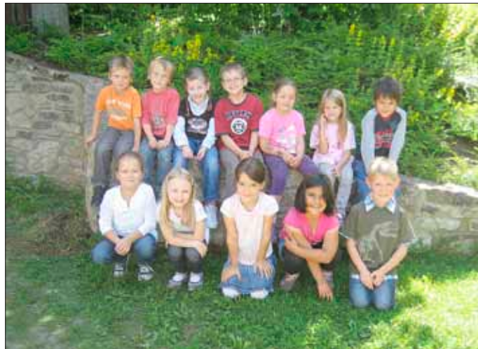
Auf Wiedersehen, Schulkindern!!

Wir wünschen ihnen viel Erfolg in der Schule und alles Gute ihnen und auch ihren Familien!!