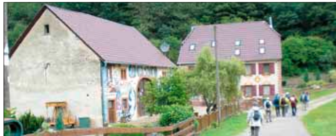
Am der Reinhardsmühle