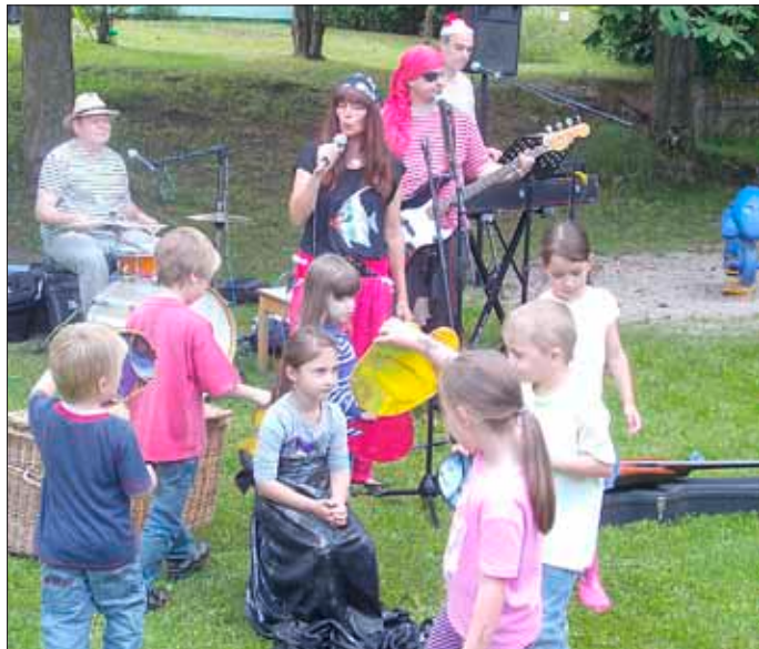
Die Meerjungfrau und ihre Fische mit ene mene mix

Wieder einmal nähert sich der Augenblick, wo wir uns von den Kindern verabschieden müssen, die nach den Sommerferien eingeschult werden. In diesem Jahr sind es 13 Kinder, die die Kita verlassen werden. Aus diesem Grund fand mit allen Kindern eine Feier statt, bei der gemeinsam gefrühstückt, gesungen und gespielt wurde. Um 10 Uhr erwarteten wir alle die Musikgruppe „ene mene mix“ mit ihrem tollen Programm „Die Kartoffelsalatpiraten“. Alle versammelten sich draußen und bald schon ging es los. Die Musik war lustig und schwungvoll, so dass es den Kindern viel Spaß machte sich zu bewegen. Außerdem durften sie sich auch verkleiden und Rollenspiele zu den Liedern machen, was natürlich besonders gut ankam. Nachdem sich die Musiker wieder verabschiedet hatten und bevor die Kinder abgeholt wurden, bekamen die „Großen“ noch ein Abschiedsgeschenk. Sie erhielten für die Schule eine große Sammelmappe, auf denen wir das Motiv des jeweiligen Ranzens gestaltet hatten.