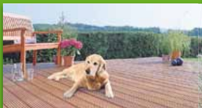
Terrassendiele Bangkirai Hartholz naturbelassen, grob/fein geriffelt 2,5 cm stark, 14,5 cm breit versch. Längen 8,95 €/lfm.