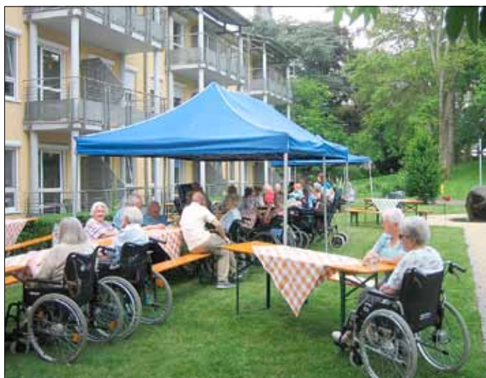
Noch war das Wetter gut