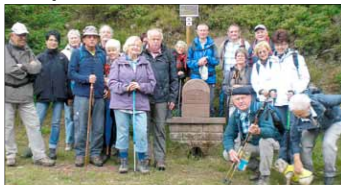
An der Quelle der roten Saar

5. Am Sonntag, dem 15. Juli 2012, findet die nächste Wanderung auf der »Hunolsteiner Klamm tour« statt. Dieser 11 km lange Weg ist als Premium-Extratour mit 65 Punkten vom Deutschen Wanderinstitut Marburg ausgezeichnet worden. Hiermit zählt sie zu den höchstbewerteten Wanderwegen Deutschlands. Treffpunkt zur Wanderung ist um 9.00 Uhr am Rathaus in Wallerfangen. Frisch Auf