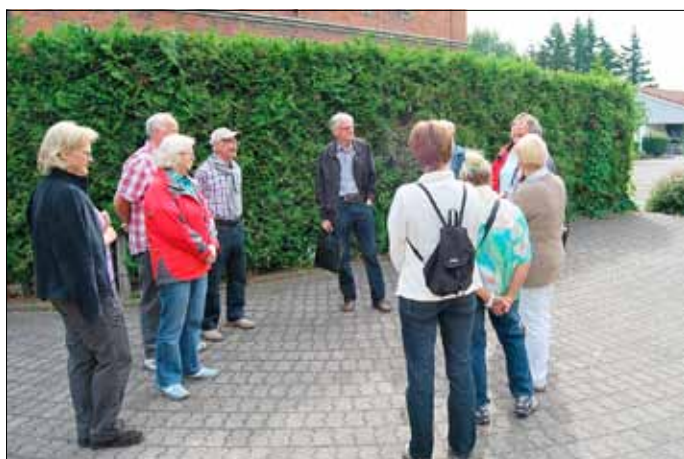
Vor dem ehemaligen Bahnhofsgebäude