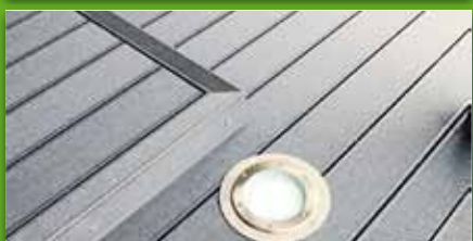
UPM Terrassendielen in 6 verschiedenen Farbtönen erhältlich 2,8 cm stark, 15 cm breit Längen 400/500/600 cm 9,95 €/lfm.