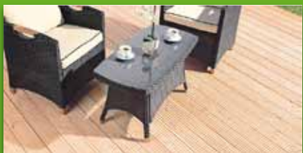
Terrassendiele Douglasie Douglasie naturbelassen, Cumulus Profil 2,8 cm stark, 14,5 cm breit Längen 300/400/500 cm 3,49 €/lfm.