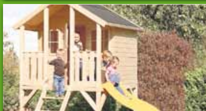
Stelzenhaus „Tobi“ Fichte naturbelassen, Sockelmaß 180x190 cm Podesthöhe 125 cm, Bausatz Mit Leiter, Tür und Sprossen. 499,- €/St.