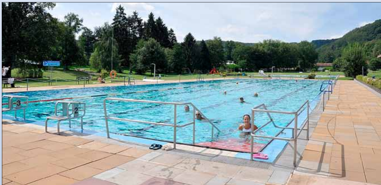
Im Wallerfanger Freibad haben Sie Platz zum Schwimmen

Terminvorankündigung: Die diesjährige Mitgliederversammlung des Fördervereins Freibad findet am 6. August um 19.30 im Freibad statt