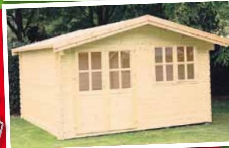
Blockbohlenhaus „Isar“ Nadelholz naturbelassen, 28 mm Wandstärke Wandbohlenmaß 400x 400 cm Selbstbausatz statt 1499,- 1250,- €/St.