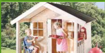
Kinderspielhaus „Nick“ Fichte naturbelassen, Sockelmaß 180x180 cm Höhe 165 cm, Selbstbausatz mit Fußboden und Sprossenfenster 349,- €/St.