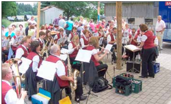
Frühschoppenkonzert MG Kerlingen, Ittersdorf-Düren auf dem Randen