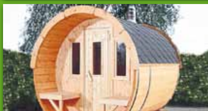
Saunafaß (in 3 Größen erhältlich) z.B. Bohlenstärke 42 mm, Durchmesser 200 cm Gesamtlänge 250 cm komplett montiert 3599,- €/St.