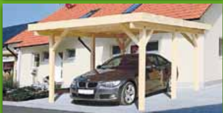
Einzelcarport „Nürnberg“ Fichte naturbelassen, Maße 360x507 cm Leimholz-Pfosten 12x12 cm Selbstbausatz 899,- €/St.