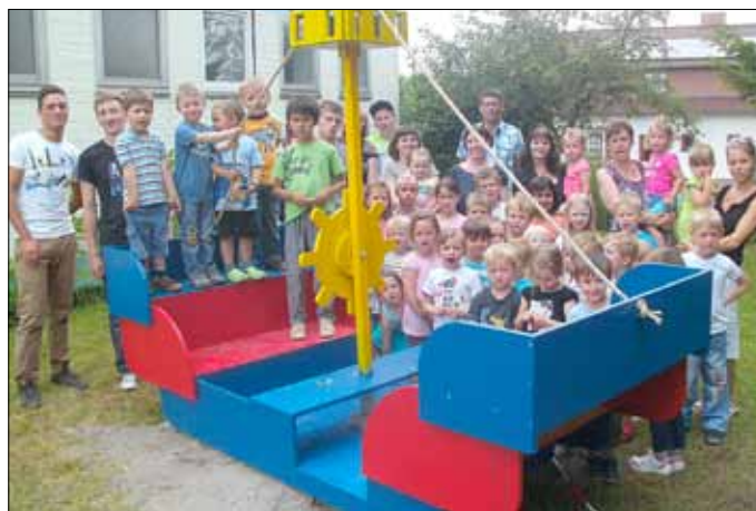
Wir alle freuen uns sehr über unser neues Spielgerät!!