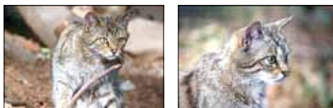
Junge Wildkatzen

Jeder Teilnehmer darf bis zu fünf Fotos einsenden, wobei er mit höchstens einem in die „Geldränge“ kommen kann. Zu beachten ist, dass bei Farbabzügen eine Größe von 40 mal 30 Zentimetern einzuhalten ist und Digitalfotos in einer Größe von mindestens einem Megabyte vorliegen. Einzureichen sind die Bilder beim Geschäftsführer des Hunsrückvereins e. V., Klaus Görg, Verbandsgemeindeverwaltung Herrstein, Brühlstraße 16, 55756 Herrstein, E-Mail k.goerg@vg-herrstein, Telefon 06785/79151. Einsendeschluss ist am 31. August 2012. Dort können auch die Teilnahmebedingungen angefordert werden bzw. auf der Homepage www.wildfreigehege-wildenburg.de eingesehen werden.