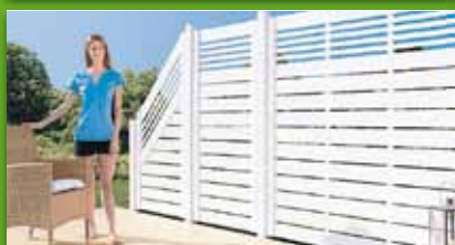
Zaunserie „Malaga“ Kiefer imprägniert im Farbton Weiß oder Steingrau endbehandelt. z.B. Grundelement 180x180 cm 139,- €/St.