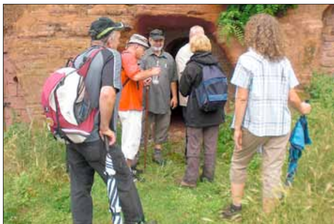
Vor den Felsenkellern