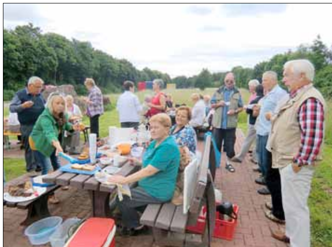
Kleine Stärkung kurz vor Pirmasens

An diesem Tag mussten wir noch am Nachmittag unter dem Sonnenschirm Schutz vor der Sonne suchen.