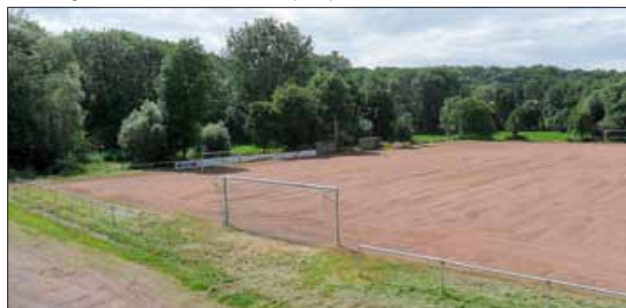
Sportplatz der SG Ihn-Leidingen

Am Samstag, 23.06.2012, fand das erste Training der neuen Saison statt. Der Trainingsbesuch war vielversprechend - weiter geht es nächsten Sonntag ab 11.00 Uhr auf dem Sportplatz Ihn.