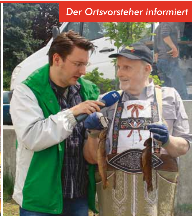
Der Ortsvorsteher informiert