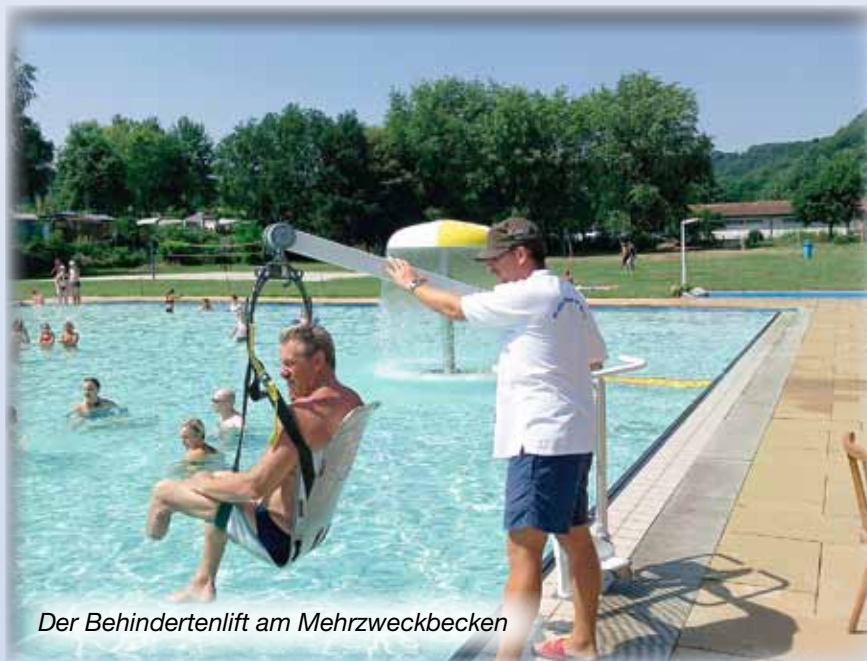
Der Behindertenlift am Mehrzweckbecken

Seit 2 Jahren besitzt das Wallerfanger Freibad einen Behinderten-Duschraum mit bodengleicher Dusche und Behindertentoilette.