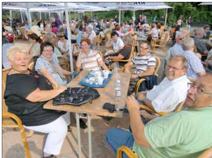
Kurze Rast unserer Mitglieder / Vereinsfahrt 2011

Das Ziel unserer Vereinsfahrt ist das Kakteenland bei Bad Bergzabern am Samstag 16. Juni 2012. Abfahrt ist um ca. 9.00 Uhr am ehemaligen Dorfladen Gisingen vorgesehen. Unterwegs werden wir noch eine Imbisspause einlegen. Die vorgesehene Ankunft wird in Steinfeld ca. 12.00 Uhr sein.