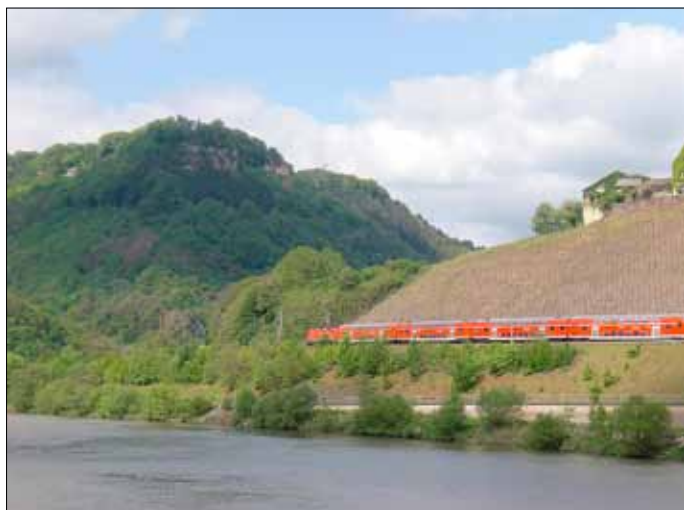
Blick auf die Klause bei Kastel-Stadt