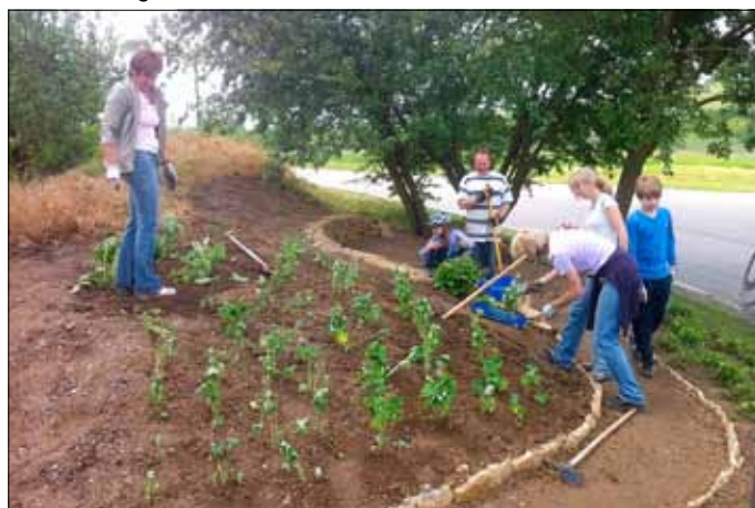
Arbeiten am Kirmesplatz