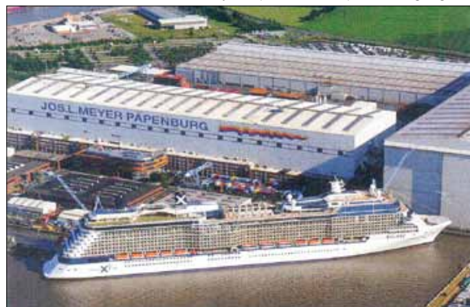
Im Rahmen unserer Vereinsfahrt steht auch eine Führung durch die MEYER-WERFT in Papenburg auf dem Programm

10.00 Uhr Rückreise mit Einkehr im Eifelbrauhaus MENDIG Für weitere Auskünfte steht Harry Ehl (06837/74192) zur Verfügung.