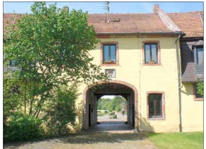
Der Eichelscheiderhof bei Miesau