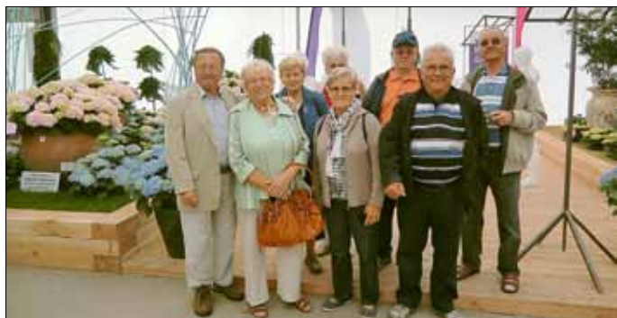
Vereinsfahrt 2011: Bundesgartenschau Koblenz