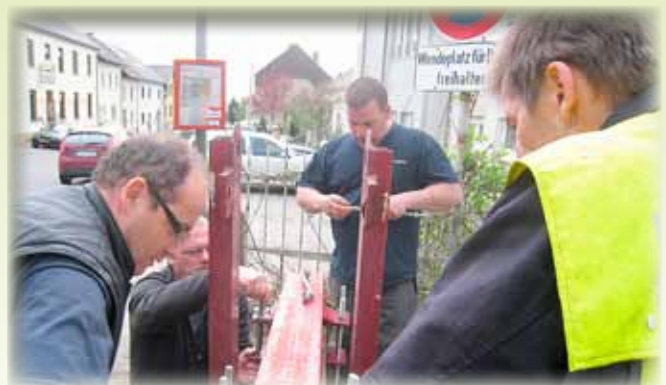
Fachmänner am Werk