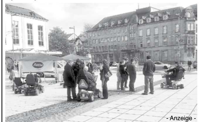
Das Foto zeigt Mitarbeiter der Firmen Agesa und OSC beim Kundengespräch und Interessenten bei einer Testfahrt.

Mobilität im Alltag, oft ein großes Problem für ältere oder gehbehinderte Menschen. Unter diesem Blickwinkel veranstaltete das seit 2011 in Saarlouis, Lothringer Str. 3-5, ansässige „Gesundheitscenter Kleiner Markt“ Agesa Sanitätshaus und OSC Orthopädie Schuh Center, am Samstag 21.04.2012, einen Scooter Tag. Interessenten konnten zwischen 10:00 - 16:00 Uhr kostenlos einen der vielen Elektro Scooter von verschiedenen Herstellern mit diversen Leistungsstärken ausprobieren und vergleichen. Trotz des nicht idealen Wetters wurde von dem Angebot einer Probefahrt reichlich Gebrauch gemacht. Für ältere oder gehbehinderte Menschen ist solch ein „Gefährt“ eine tolle Möglichkeit, ohne fremde Hilfe, tägliche Wege oder Ausflüge zu jeder Zeit zu absolvieren. Elektro Scooter erlauben Geschwindigkeiten zwischen 6-15 KM/h, sind praktisch, einfach zu bedienen, mit aufladbaren Akkus ausgestattet und ohne Führerschein auch im Straßenverkehr zu nutzen. Eine Helmpflicht besteht nicht. Darüber hinaus, darf sogar mit Schrittgeschwindigkeit auf Gehwegen und in Fußgängerzonen gefahren werden. Der nächste Scooter Tag findet am Samstag, dem 12.05.2012, in Saarbrücken in der Bahnhofstraße / Ecke Sulzbachstraße in der Zeit von 10:00 – 16:00 Uhr statt. Auch hier wird es reichlich Gelegenheit geben, sich über Scooter zu informieren und zu testen.