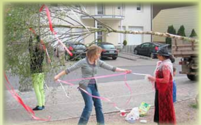
Fachfrauen am Werk