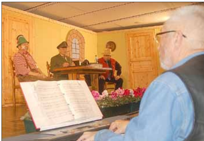
Auch die Gauspatzen sind in Heiningen mit von der Partie