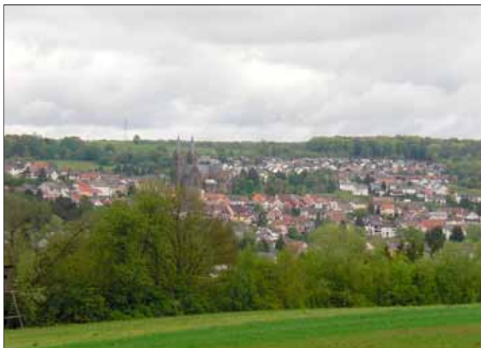
Auf dem Rückweg zur Fischerhütte bei Püttlingen

2. Am Sonntag, dem 13. Mai 2012, führt Michael Schönhofen die mittlerweile schon traditionelle Muttertagswanderung um Differten. Die Wanderung hat eine Länge von rund 14 km. Treffpunkt ist um 9.00 Uhr am Rathaus in Wallerfangen.