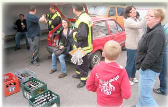
Verdurstet ist wohl keiner