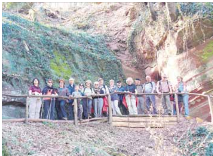
Wanderung vom 25. März 2012 über die Höhen des Saargaus