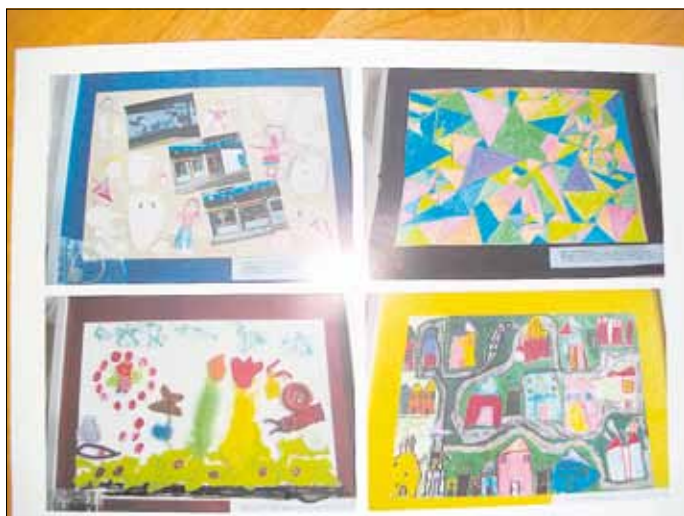
Kunst von den Kindern der Kita Gisingen

Am Freitag, dem 24.03. wurde im Rathaus Wallerfangen eine Kunstausstellung eröffnet. Auch die Kinder der Kita Gisingen haben sich daran beteiligt. Es entstanden vier unterschiedliche Gemeinschaftsarbeiten von Kindern im Alter von 3 bis 6 Jahren. Die Themen wurden gemeinsam mit den Kindern ausgewählt, dann ging es aktiv an die Gestaltung der Bilder. Eine Idee war, dass die Kinder gemeinsam ein Dorf malen wollten, so wie sie es sich wünschen würden. Eine andere Idee war es, den Kindergarten zu fotografieren und sich selbst zu malen, auszuschneiden und um die Fotos herum aufzukleben. Dann gestalteten sie noch ein Frühlings-Bild aus vielen verschiedenen Materialien, wie Knöpfen, Federn, Stoff... und zuletzt entstand noch ein ganz buntes Bild, das mit Neonfarben ausgemalt wurde. Anschließend wurde überlegt, welchen Namen die Bilder erhalten sollten, dann war alles fertig. Die Kinder haben viel Zeit und Arbeit, aber auch ganz viel Spaß in ihre Kunst hineingesteckt und so hat es ihnen große Freude gemacht. Wir machen Osterferien in der Zeit vom 05. bis 13.04.2012. Wir wünschen Ihnen allen ein frohes und sonniges Osterfest. Die Mitarbeiterinnen der Kita Gisingen