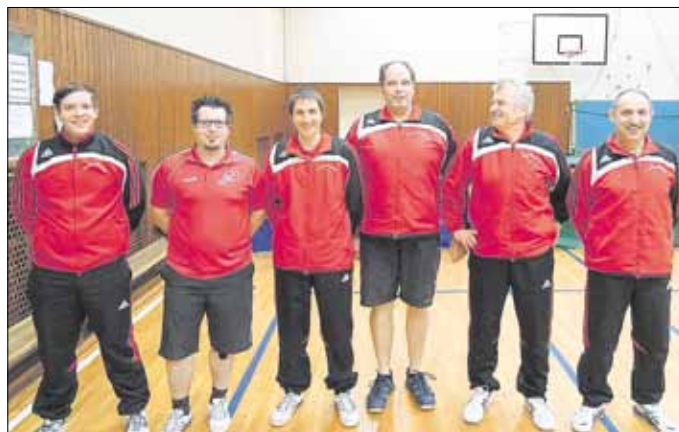
1. Herren des TTC Wallerfangen