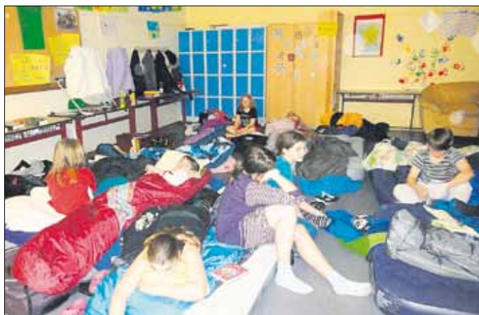
Ganztagsklasse 5.3 bei ihrer Lesenacht