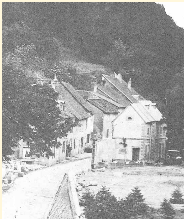
Die Häuser der Schwantzgass klebten am abgestuften Hang des Limbergs gegenüber von Schloss Villeroy. Die Felsenwohnungen waren am Ende der Häuserreihe in die Steilwand geschlagen.

Die Schwantzgass hatte aber noch eine weitere Überraschung zu bieten. Ein paar Schritte weiter stieß man auf ein Kuriosum, das damals seinesgleichen suchte. Die bedrückende Sehenswürdigkeit präsentierte sich in Form von Wohnungen in den sogenannten Niederlimberger Felsenhöhlen. Die primitiven Behausungen bestanden aus Gängen und Kammern, die in den weichen Buntsandstein des fast senkrecht abfallenden Limbergs eingehauen waren. Die einzelnen, sorgfältig aus dem Stein gearbeiteten Räume waren durch Türöffnungen und Verbindungsgänge miteinander verbunden und zum Teil mit aus dem Fels gemeißelten Scheingewölben ausgestattet. Hier lebten die Ärmsten der Armen, die die Mieten für bessere Wohnungen nicht bezahlen konnten.