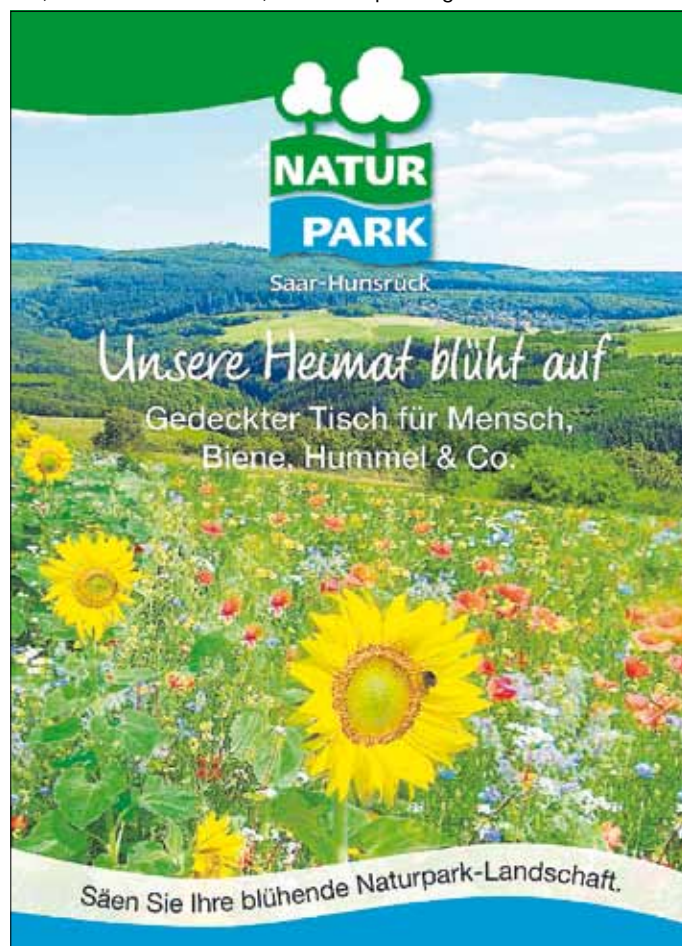
Titelbild des Naturpark-Saattütchens „Unsere Heimat blüht auf“