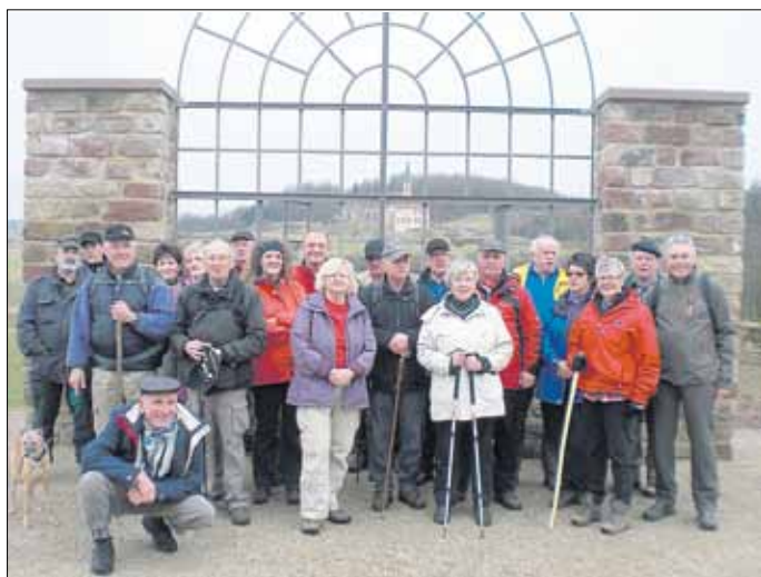
Vor dem Fenster „Grenzblick“ auf deutscher Seite mit Blick auf das französische Fenster