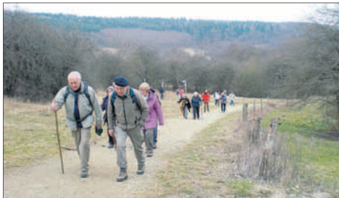
Letzte Steigung vor dem Fischerberghaus