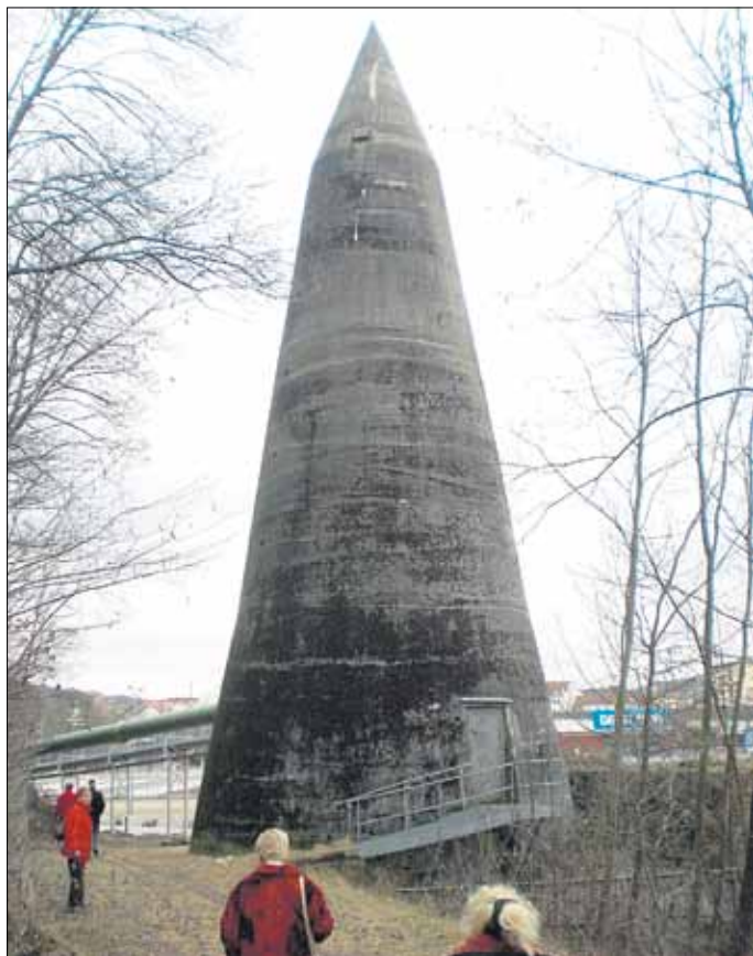
Spitz- oder auch Winkelbunker

zur Wasserversorgung der Hochöfen gebaut wurde. Sein Fassungsvermögen waren 2.150 cbm. Dann ging es zur Stumm'schen Reithalle, die als Reitbahn für die Kinder von Karl Friedrich Stumm genutzt wurde, später als Wagenschuppen (1880), als Feuerwehrhaus, als Lehrwerkstatt und heute als Eventhalle. Weiter ging es am Hammergraben vorbei zum Spitzbunker (Platz für über 400 Personen).