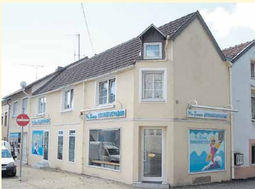
Früher: Nalbach's Erna, Metzgereifiliale von Mouget's Heini - Hospitalstraße 10, Ecke Adlerstraße Heute: Sonnenstudio

(Text: Arnold Imig)