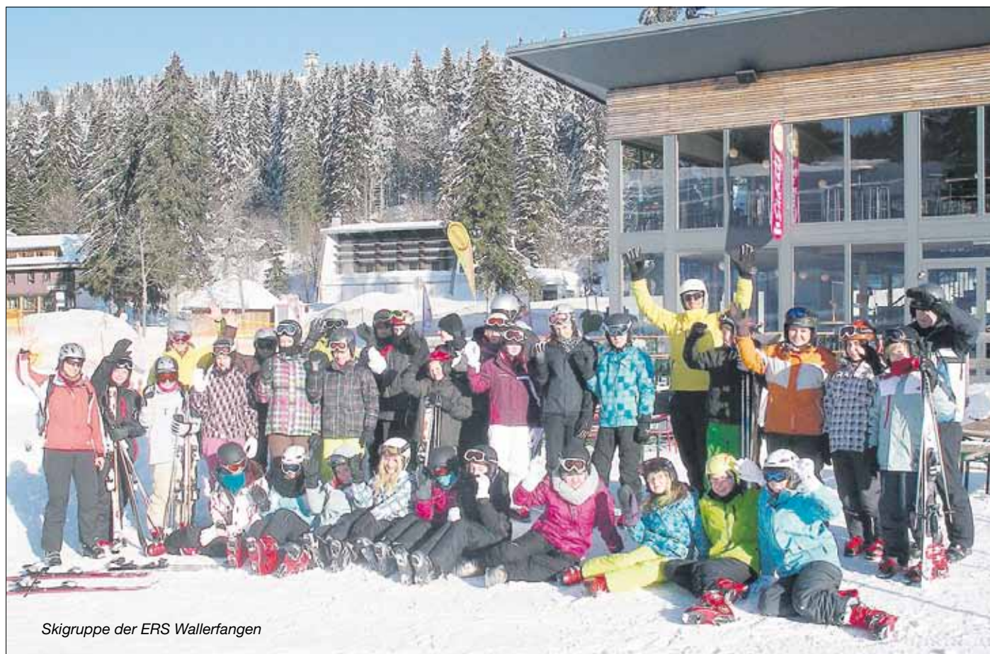
Skigruppe der ERS Wallerfangen

Fast alle bekräftigten, dass die Skiwoche anstrengend gewesen sei, dass ihnen das Skifahrenlernen aber auf jeden Fall mehr Spaß gemacht habe als Deutsch und Mathe.