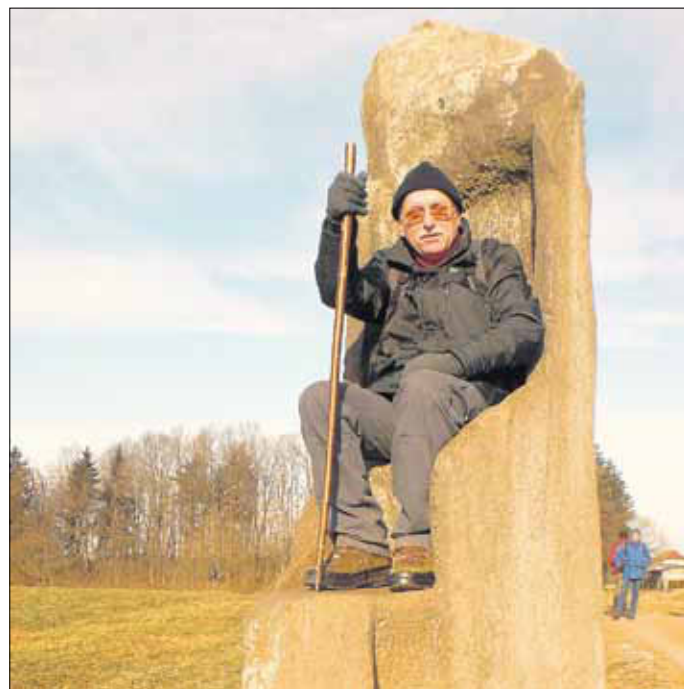
Franz auf einer Skulptur namens „Thron“

erten die Arbeiten und wurden 1993 noch einmal mit der 5 km langen Strecke bis zum Petersberg fortgesetzt. Gewidmet ist die Straße dem deutsch-jüdischen Bildhauer und Maler Otto Freundlich. Freundlich, der in Paris lebte, träumte schon in den 30er Jahren von einer Straße der Skulpturen, von einer völkerverbindenden Straße, wie er schrieb „une voie de la fraternité et solidarité humaine“ (eine Straße der Brüderlichkeit und menschlichen Solidarität). 53 bis zu 9 Meter hohe und bis zu 65 Tonnen schwere Steinblöcke bilden die Skulpturenstraße, an der 49 Künstler aus 11 Ländern arbeiteten. Ein Fixpunkt in der Landschaft ist die 6 m hohe Skulptur des Österreicherers Franz-Xaver Ölztant bei Gudesweiler, die sich mit ihren gerundeten Formen prima in die hügelige Umgebung einfügt. Ölztant hat den Block von oben nach unten bearbeitet und dem kantigen Riesen 1979 in fast viermonatiger Arbeit eine neue Form gegeben. Um einen Kern, eine Kuppel, schließen sich organisch, wie bei einer Knospe etwa, in drei verschiedenen Ebenen längliche, gerundete Formen. Der Name der Skulptur ist »Wolkenstein«. Bis zum Bostalsee waren es über 40 Kunstwerke die zu bestaunen waren. Schlussrast wurde im Römerhof am Bostalsee gehalten, wo wir sehr freundlich bedient wurden.