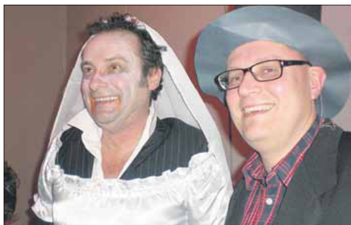
so kannes gehen beim Erdbeerball

Viel Spaß an unserem Umzug und eine schöne Fastnachtzeit wünschen die Hansenberger Erdbeernarren