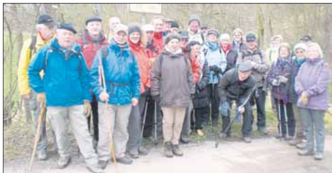
An der Brücke der Freundschaft

für den Rückweg motivieren. In der schönen Schwerdorfer Kirche sang Michael noch ein schönes lateinisches Lied. Der Rückweg gestaltete sich etwas schwierig. Der Forster lag im Grafenthal auf Mommental - kann nur der verstehen, der mit gewandert war. Es schneite den kompletten Rückweg bis nach Hemmersdorf. Der Ort entstand im Zuge der Verwaltungsreform der Nationalsozialisten im Jahre 1937 aus den zuvor eigenständigen Orten Groß-Hemmersdorf links der Nied und Kerprich-Hemmersdorf rechts der Nied.