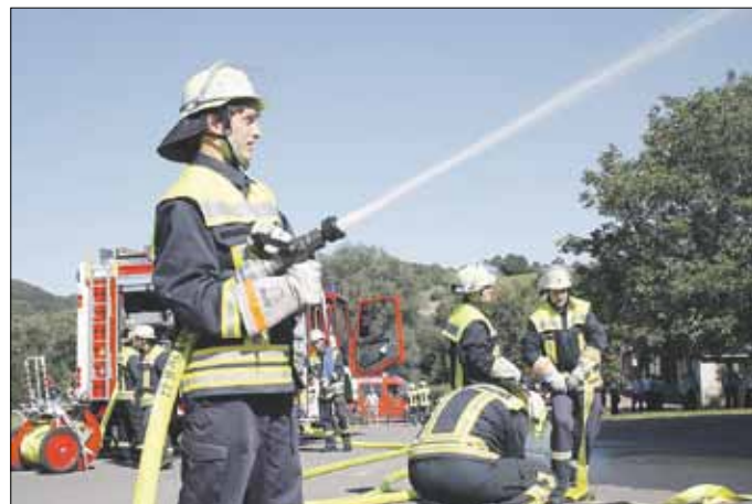
Gemeindefeuerwehrtag: Übung anlässlich des Gemeindefeuerwehrtages in Ihn