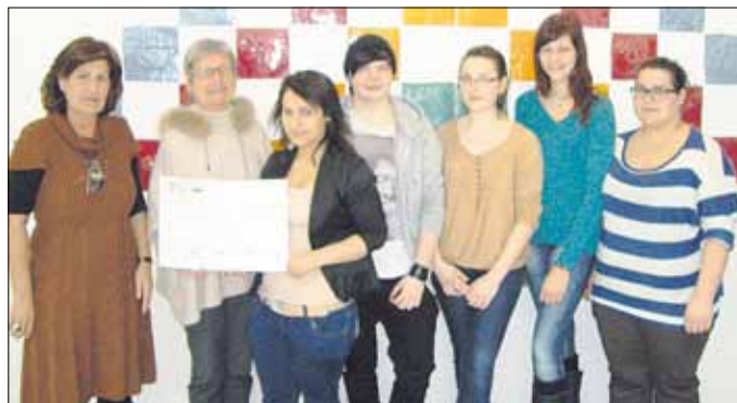
fleißige Helferinnen vom Standdienst bei der Spendenübergabe

Ein herzliches Dankeschön gilt allen Helfern und Helferinnen.