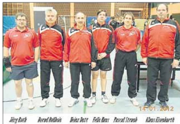
1. Jugend, 2. Jugend, 1. Herren des TC Wallerfangen