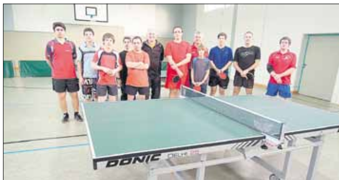
Teilnehmer des TTC Wallerfangen am TT-Lehrgang

14.01.2012 18.30 TTF Merzig - 1. Herren 14.01.2012 19.30 2. Herren - TTC Hülzweiler 14.01.2012 18.30 TTV Schwalbach 3 - 3. Herren 14.01.2012 15.00 1. Jugend - TV Geislautern 14.01.2012 15.00 2. Jugend - TC Ensdorf 14.01.2012 15.00 TTC Schwarzenholz - Schüler A 18.01.2012 20.00 1. Senioren - TTC Püttlingen 20.01.2012 19.30 TTC Beckingen - 2. Senioren