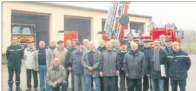
Die Seniorenabteilung zu Besuch bei den französischen Kollegen