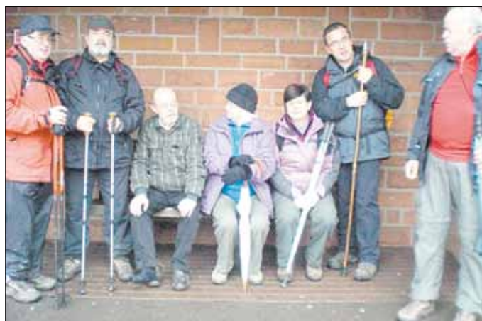
Mittagsrast in Erbringen