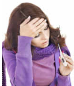
Auch bei einer banalen Erkältung fühlt man sich manchmal sehr schlecht

Diese Infekte dauern im Allgemeinen nur wenige Tage. Bei längeren Verläufen handelt es sich oft um eine Neu-Infektion.