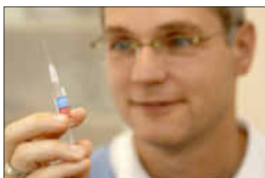
Die Grippeimpfung schützt vor einer schweren Virusgrippe

Ein Antibiotikum ist normalerweise nicht angezeigt, da es sich bei den grippalen Infekten in über 90 Prozent um Virusinfekte handelt, bei denen Antibiotika nicht wirken.